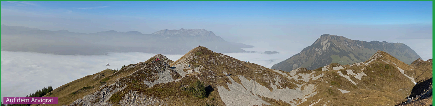
Auf dem Arvigrat

Ab der Bergstation folgen wir den Wegweisern Richtung Lang Boden. Dann gehts über das Ächerli hoch auf den Arvigrat. Dem wunderschönen Graweg folgt man bis auf 2013 m.ü.M. Das schöne Gipfelkreuz ist 15 Minuten unterhalb des Arvigrats. Zurück geht es wieder über den Arvigrat bis Regelsmatt und dann via Miserengrat, Gummenalp und Wirzweligrat zurück zum Ausgangspunkt.