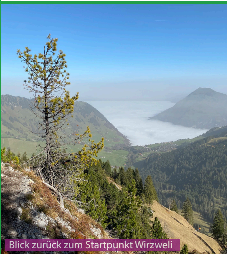
Blick zurück zum Startpunkt Wirzweli

Der Gratweg hoch zum Arvigrat ist verwurzelt und felsig und ist bei Nässe entsprechend rutschig. Der Rest der Wanderung ist sehr angenehm zum laufen. Es gibt praktisch keine gefährliche Stellen für den Hund. Es gibt aber wenig Wasser auf dem Weg, unbedingt 1 Liter Wasser für den Hund in den Rucksack packen.