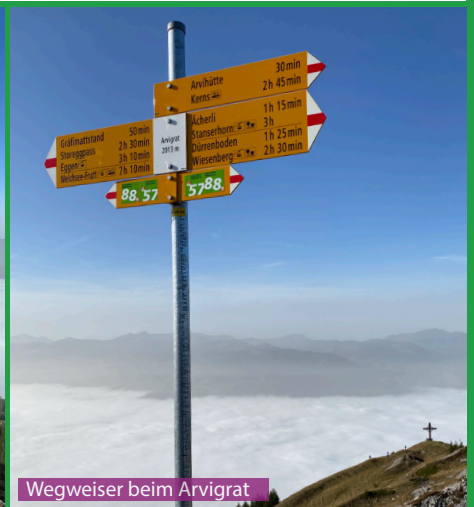
Wegweiser beim Arvigrat