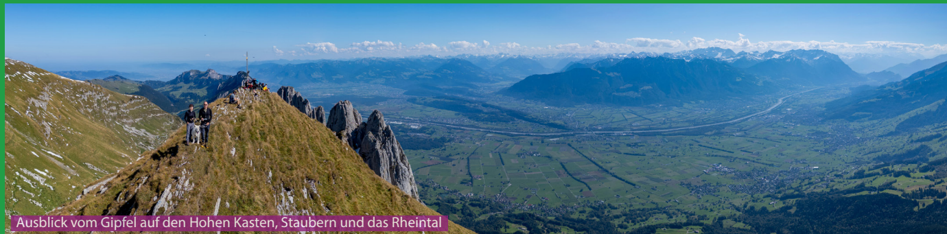
Ausblick vom Gipfel auf den Hohen Kasten, Staubern und das Rheintal

Die ganze Wanderung ist top beschildert. Bei der Teselalp muss man sich über die Richtung der Rundwanderung entscheiden. Wir sind direkt hoch zum Mutschensattel, Mutschen und dann über den Zwinglipass zur Zwinglipasshütte gewandert. In der Hütte kann man sich prima verpflegen und etwas trinken vor dem Abstieg über die Teselalp zurück nach Gamplüt.