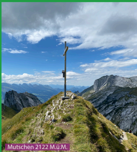
Mutschen 2122 M.ü.M.