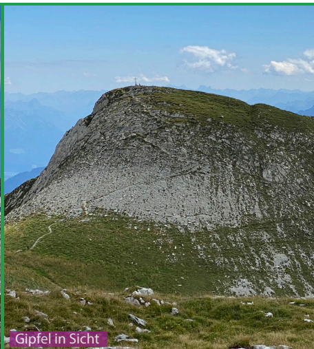
Gipfel in Sicht