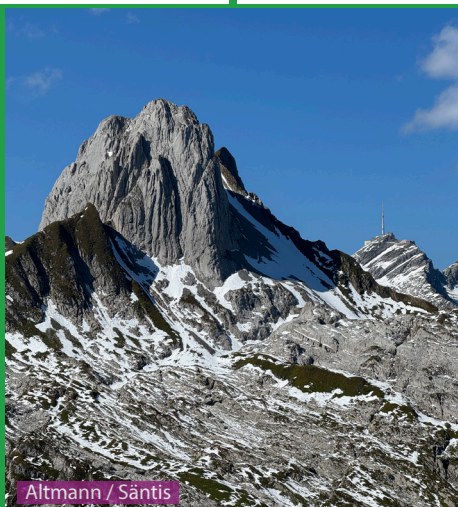
Altmann / Säntis