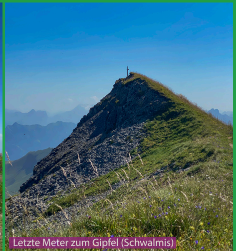
Letzte Meter zum Gipfel (Schwalmis)