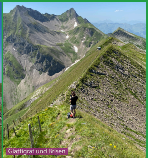
Glattigrat und Brisen