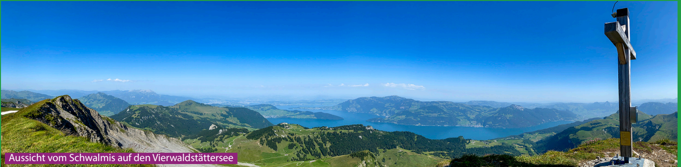
Aussicht vom Schwalmis auf den Vierwaldstättersee

Bei der Klewenalp folgen wir den Wegweisern Richtung Schwalmis / Risetenstock. Über Tannibüel gehts zur Bergstation Chälen und hoch bis zum Hinter Jochli. Wer fit genug ist läuft jetzt zuerst zum Schwalmis und dann zurück und hoch zum Risetenstock. Wer direkt zum Risetenstock läuft, macht die Wanderung in knapp 5h mit 920 Höhenmeter. Retour über Glattigrat und Brisenhaus zur Klewenalp.