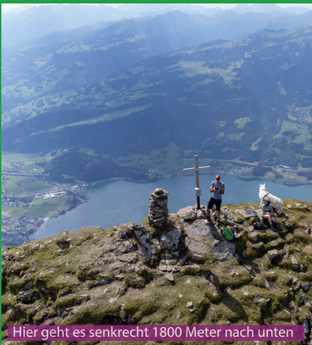
Hier geht es senkrecht 1800 Meter nach unten

Ein sportlicher Hund kann diese Wanderung ohne Hilfe meistern. Die Wege sind aber oft felsig (Karst) und löchrig (Kalk). 5 Minuten vor dem Gipfel sollte der Hund angeleint werden, da es doch extrem ausgesetzt ist auf der Kante zum Walensee. Es gibt einige Kuhtränken bis zum Brisizimmer unterwegs. 1 Liter Wasser für den Hund und eine Belohnung auf dem Gipfel gehören in den Rucksack.