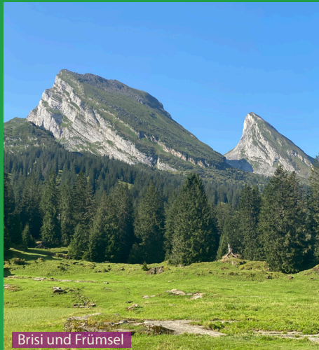
Brisi und Frümsele