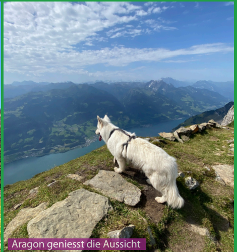
Aragon genießt die Aussicht