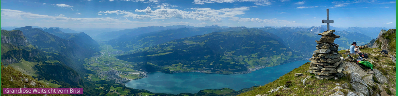
Grandiose Weitsicht vom Brisi

Wir folgen den Wegweisern erst Richtung Zinggen und von da erst Richtung Brisi. Der Weg führt uns leicht ansteigend bis zum Brisizimmer. Ab da wird es steil. Man durchquert das Felsband bei Punkt 1798 und läuft dann auf dem sanften Rücken des Brisi hoch bis zum steinigen Gipfel. Retour gleich bis zum Brisizimmer, dann aber nach links zum Thurtalerstofel und auf dem Sagenweg zurück zur Bahn.