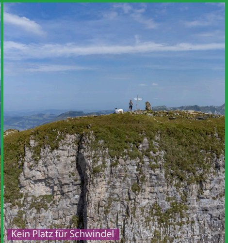
Kein Platz für Schwindel