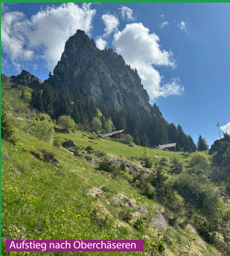
Aufstieg nach Oberchäseren

Eine sehr schöne Wanderung für einen sportlichen und berggängigen Hund. Es gibt keine Stellen, die der Hund nicht selbständig überwinden kann. Beim Weg zum Gipfelkreuz Oberchäseren muss man den Hund kontrollieren, unweit des Weges geht es über Hundert Meter senkrecht herunter. Bäche und Kuhtränken hat es oft auf dem Weg und ein Bad im Golzeren See am Schluss ist auch möglich.