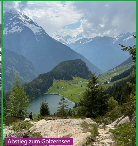
Abstieg zum Golzersee