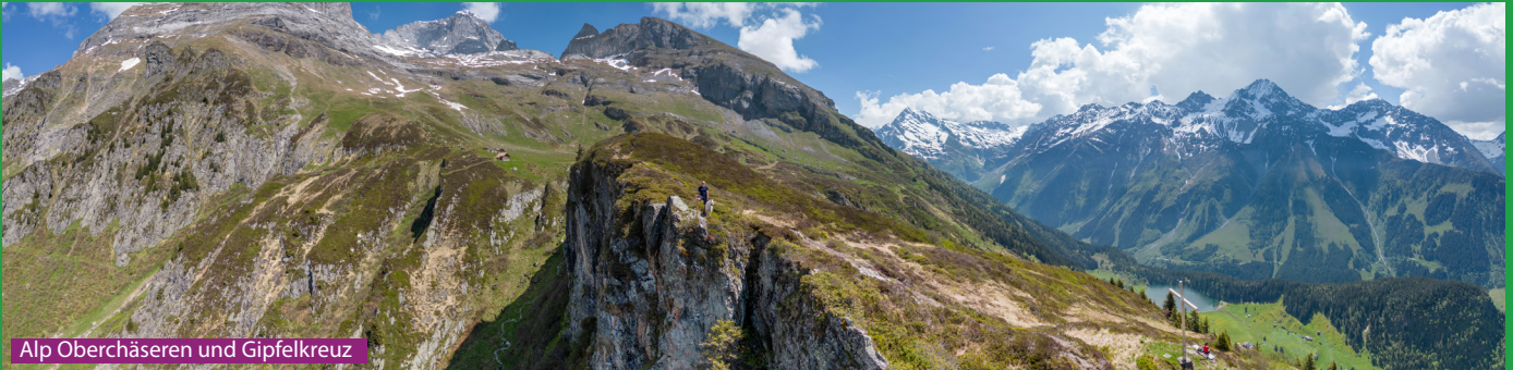
Alp Oberchäseren und Gipfelkreuz

Ab der Bergstation gut beschildert dem Wegweiser Richtung Oberchäseren folgen. Hier führt ein sichtbarer aber ausgesetzter Pfad zum Gipfelkreuz. Dann zurück zum Wanderweg und über Bernetsmatt (noch ein Gipfelkreuz) zur AACZ Hütte Windgällen. Der Abstieg führt beim Golzerensee vorbei und via Strandbad um ihn herum. Über Seewen (2 Restaurants) geht es dann zurück zur Bergstation.