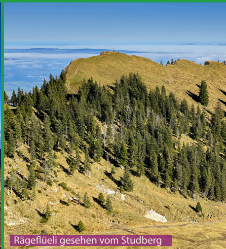
Rägeflüeli gesehen vom Studberg