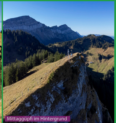
Mittagggüpi im Hintergrund