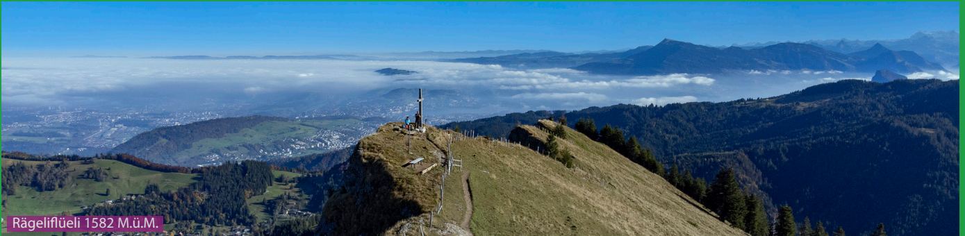
Rägeflüeli 1582 M.ü.M.

Die Wanderung ist gut beschildert. Beachten sie die Karte und unser GPS File. Den Wegweisern beim Parkplatz folgen wir zuerst Richtung Rosebode / Rägeflüeli. Vom Rägeflüeli geht es zuerst ein wenig retour und dann hoch zum Studberg. Dann hinunter zum Hirsbode und zurück nach Eigenthal (Parkplatz Gantersei) über Oberpfyfferswald (Alpbeizli Eigenthal) und Ober Honegg.