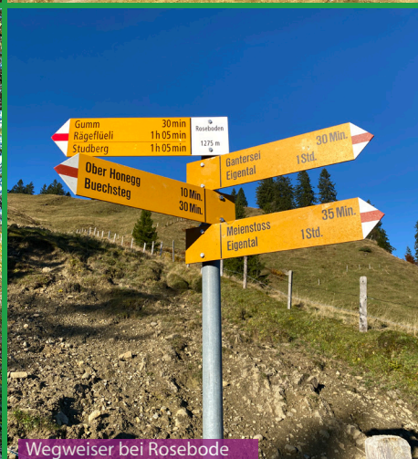
Wegweiser bei Rosebode