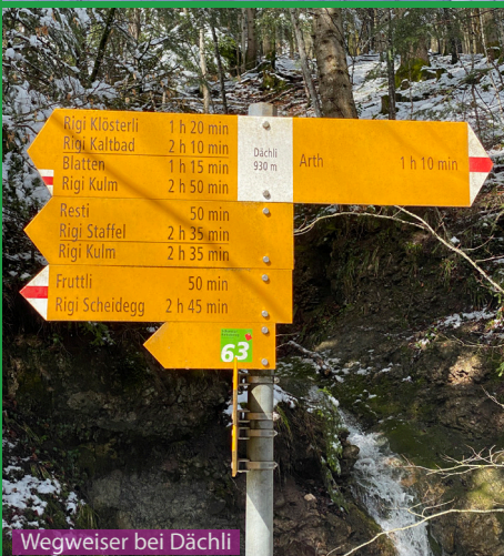
Wegweiser bei Dächli