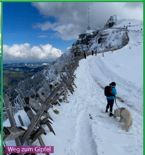
Weg zum Gipfel