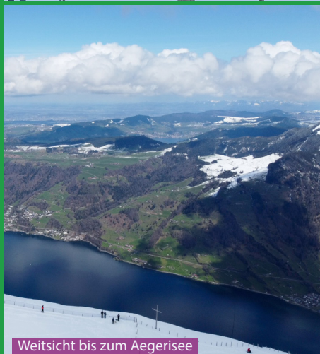
Weitsicht bis zum Agerisee