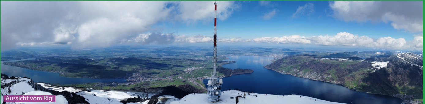
Aussicht vom Rigi

Folgen sie den Wegweisern Richtung Rigi Kulm, Rigi Klösterli oder Rigi Staffel aber nicht Richtung Rigi Scheidegg. Es gibt auf dem Weg einige Alternativen und Abkürzungen auf die Rigi. Wer die Wanderung im Winter macht oder wenn noch Schnee liegt, sollte ab Rigi Klösterli auf der geteerten Strasse Richtung Rigi Staffel laufen. Einige Restaurant sind nicht das ganze Jahr offen (vorher googeln).