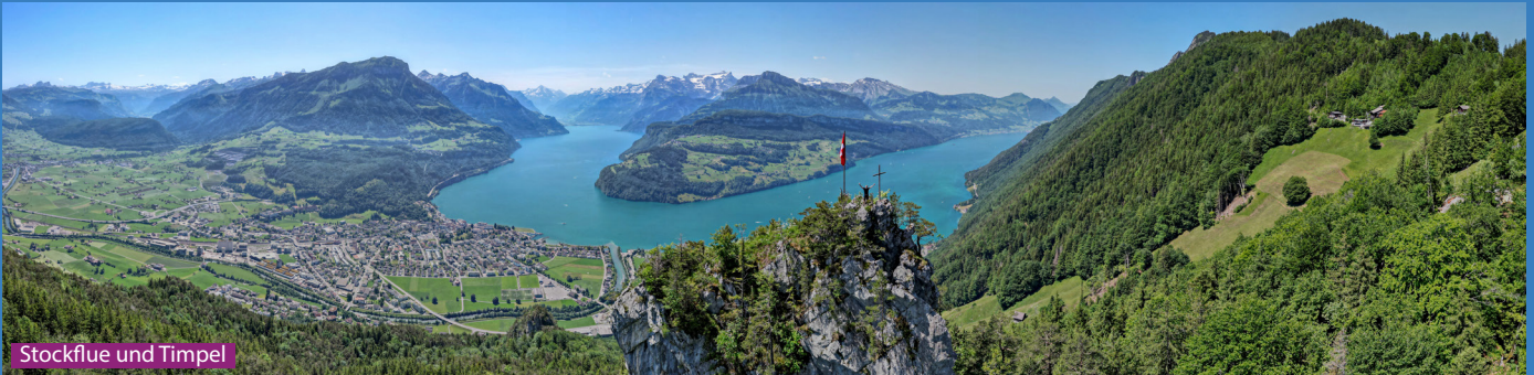
Stockflue und Timpel

Der Wanderweg führt uns gut beschildert und sehr steil über Dörfli, Stöck und Unter Timpel auf den Timpel und dann innerhalb 10 Minuten auf den Stockflue. Danach geht es via Bergrestaurant Timpel auf den höchsten Punkt der Wanderung, zum Gottertli. Dann geht es wieder steil bergab via Berghaus Bärfallen zurück zur Talstation der Luftseilbahn Urmiberg.