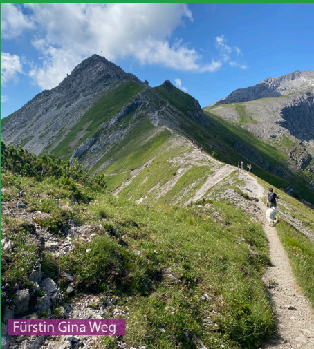
Fürstin Gina Weg

Eine sehr lange Wanderung auch für einen gut konditionierten Hund. Bitte genügend Wasser mitnehmen (1 Liter), es hat nur wenig Wasserstellen unterwegs. Auf dem Naafkopf hat es oft Steinböcke, Hunde mit Jagdtrieb hier an die Leine nehmen. Die Aufstiege haben keine besonders schwierigen Stellen sind aber teilweise ausgesetzt. Bei grossen Felsstufen braucht der Hund ab und zu etwas Hilfe.