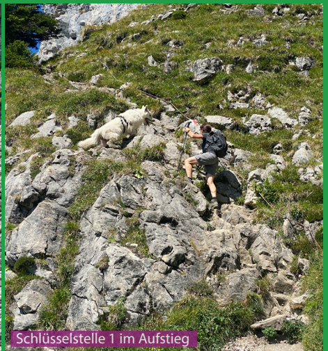
Schlüsselstelle 1 im Aufstieg