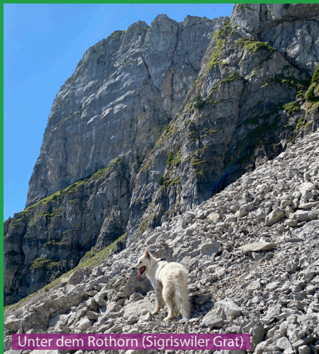
Unter dem Rothorn (Sigriswiler Grat)