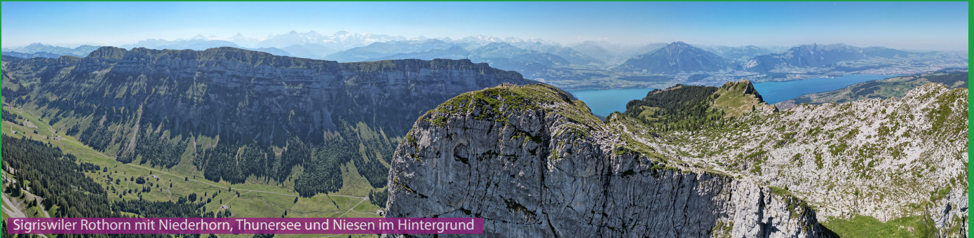
Sigriswiler Rothorn mit Niederhorn, Thunersee und Niesen im Hintergrund

Wir starten in Säge und laufen über Stampf links Richtung Obermatte / Zettenalp bis zum Punkt 1583. Hier laufen wir Richtung Sigriswilergrat und erreichen via Schafloch (Eingang zu 600 Meter langem Stollen) Stäpfli/Schafläger. Jetzt geht es nach der Hangquerung über einige Schlüsselstellen hoch zum Gipfel. Retour folgen wir den Wegweisern nach Oberbergli / Bodmi / Stampf und Schwanden.