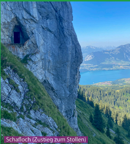
Schafloch (Zustieg zum Stollen)