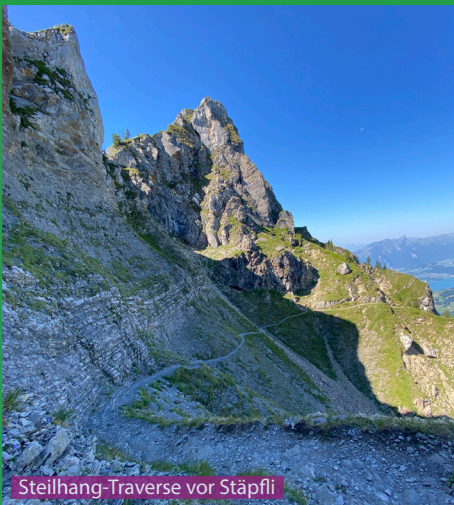
Steilhang-Traverse vor Stäpfli

Eine anspruchsvolle Wanderung auch für berggängige Hunde. Man muss den Hund einige Male beim Aufstieg unterstützen und mit Ziehen und Schieben die Schlüsselstellen kurz vor und zum Gipfel meistern. Auf dem Sigriswilergrat hat es Schafe und evtl Steinwild, hier muss der Hund an die Leine genommen werden. Bitte genug Wasser auch für den Hund mitnehmen für diese anstrengende Tour.