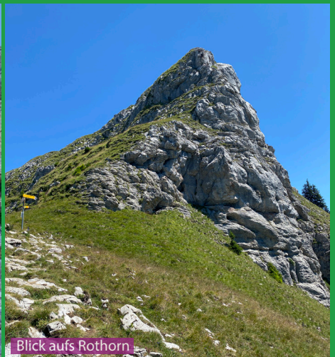
Blick aufs Rothorn