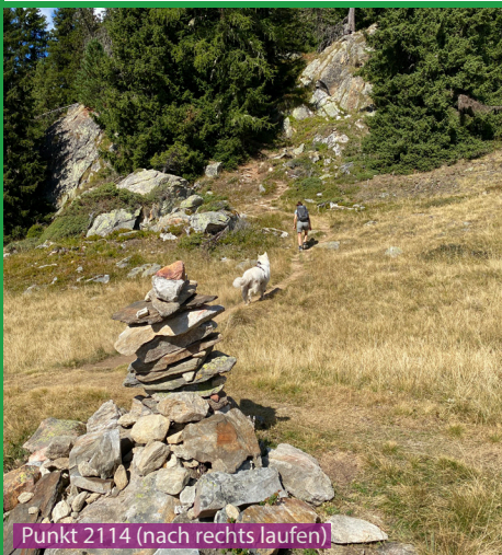
Punkt 2114 (nach rechts laufen)

Eine sehr schöne Wanderung mit einem Hund. Beim Aufstieg zum Riederhorn durchläuft man eine Kuhweide. Im Aletschwald (Jagdbanngebiet) gehören jagende Hunde an die Leine. Es gibt genügend Wasser unterwegs (Kuhtränken bis Riederfurka). Am Schluss läuft man beim Blausee und Bettmersee vorbei wo der Hund wieder trinken oder im Wasser baden kann.