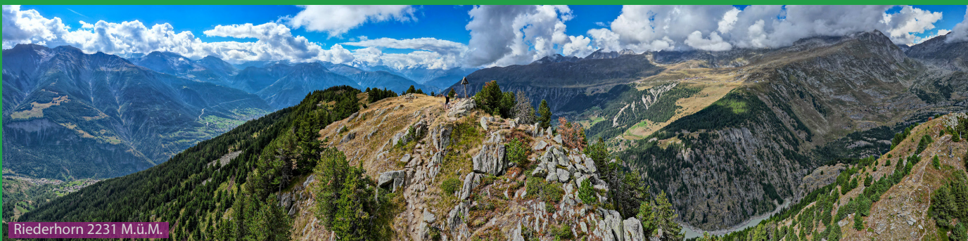
Riederhorn 2231 M.ü.M.

Ab Riederalp Richtung Riederfurka, dann aber links dem Wanderweg unter dem Riederhorn durch entlang. Beim Punkt 2114 (kein Schild!) laufen wir rechts hoch auf dem Grat bis zum Riederhorn. Abstieg nach Riederfurka und dann auf dem Lengmoosweg durch den Aletschwald Richtung Bischofsitz. Wegpunkte 2145 und 2240 beachten, dann Abstieg zur Bettmeralp an den 2 Seen vorbei.