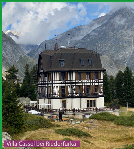
Villa Cassel bei Riederfurka