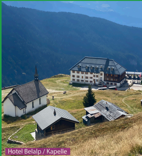
Hotel Belalp / Kapelle