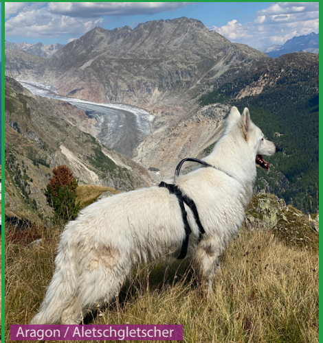
Aragon / Aletschgletscher