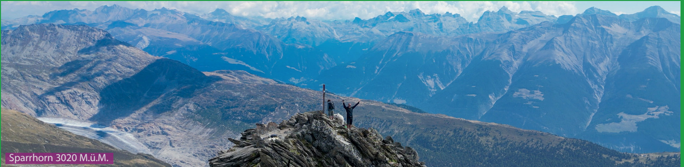
Sparrhorn 3020 M.ü.M.

Von der Bergstation der Seilbahn laufen wir über Ruchegg (Talstation Sparrhorn Sessellift) via Tyndalldenkmal und Hohbiel hoch zum Sparrhorn. Beim Abstieg laufen wir links vom Stausee in Hohbiel vorbei (Wanderweg nicht beschildert) via Tyndalldenkmal zum Hotel Belalp mit wunderschöner Terrasse. Hier ist auch der Aussichtspunkt Aletschbord. Dann auf breitem Weg zurück zur Seilbahn.