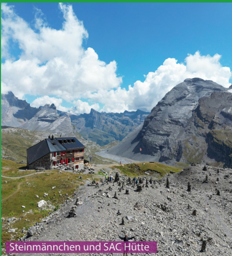
Steinmännchen und SAC Hütte

Eine problemlose Wanderung für berggängige Hunde bis zur Lämmerenhütte SAC. Es gibt viel Schmelzwasser unterwegs, so dass der Hund genug trinken und spielen kann. Der Weg zur Gletscherzunge ist ab dem Lämmerengletscher kritischer. Hier muss man dem Hund den Weg weisen und er sollte beim und auf dem Gletscher nicht unkontrolliert herumlaufen.