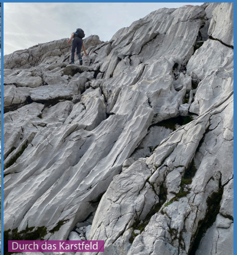
Durch das Karstfeld