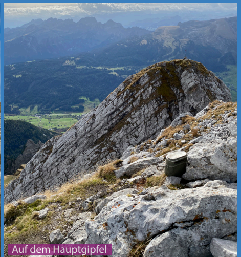
Auf dem Hauptgipfel