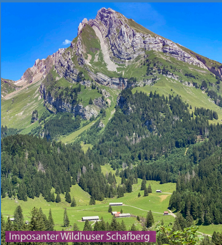
Imposanter Wildhuser Schafberg

Wer mit dem Hund auf den Schafberg wandert, sollte den rot-weißen Wanderweg wählen. Beim Vorgipfel ist allerdings Schluss für den Hund, zum Hauptgipfel geht es zuerst 10 Meter fast senkrecht runter. Auf dem Alpinwanderweg geht es vor Punkt 2068 etwa 50 Höhenmeter eine Steilwand hoch, diese Stelle schafft ein Hund kaum ohne Hilfe. Die Karstfeldquerung vor dem Sattel ist heikel.