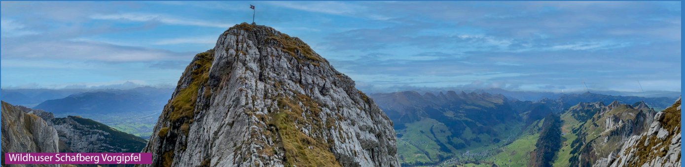
Wildhuser Schafberg Vorgipfel

Bei der Bergstation folgen wir den Wegweisern Richtung Zwinglipass bis zum Punkt 1389 wo der blau-weiße Wanderweg abzweigt Richtung Schofberg. Beim Punkt 2068 laufen wir links zum Sattel und dann hoch zum Vor- und Hauptgipfel des Wildhuser Schafbergs. Retour bis zum Sattel und dann rot-weiss über die Schöferhütte zurück zur Bergstation Gamplüt. Der Weg ist immer sehr steil.