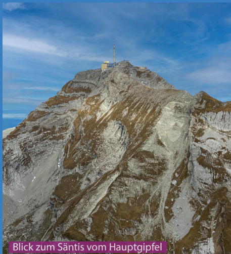
Blick zum Sântis vom Hauptgipfel