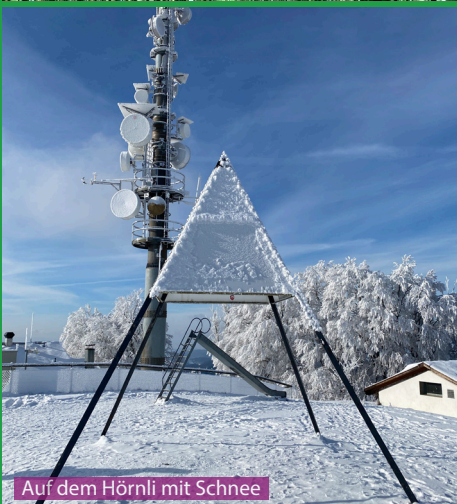
Auf dem Hörnli mit Schnee