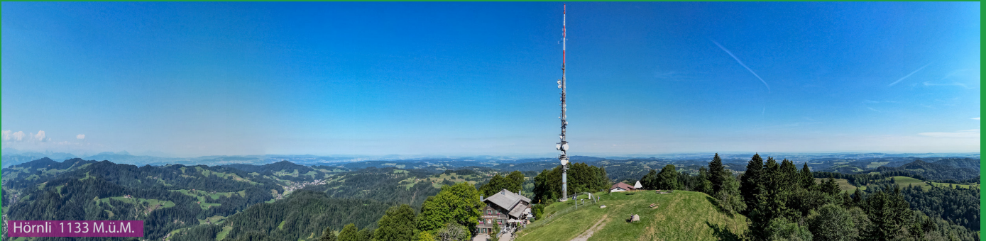
Hörnli 1133 M.ü.M.

Beim Bahnhof folgen wir den Schildern Richtung Hörnli, zuerst durch das Dorf, dann über eine Brücke. Kurz danach (bei den Lamas) verlassen wir die Strasse und laufen links den Wanderweg hoch. Beim Stall Breitenweg laufen wir links die Wiese hoch und bei Rietli laufen wir links hoch in den Wald um unter dem Hörnli entlang via Punkt 1008 zuerst aufs Chlihörnli und dann aufs Hörnli zu gelangen.