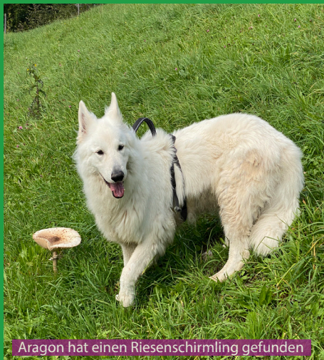
Aragon hat einen Riesenschirmling gefunden