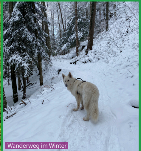
Wanderweg im Winter