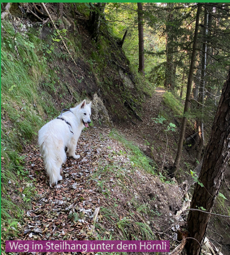
Weg im Steilhang unter dem Hörnli

Eine wunderschöne, kurze Wanderung für einen Hund. Wir machen diese Tour bei jedem Wetter im Sommer und im Winter. Wir empfehlen Sonntage zu vermeiden, weil es dann einfach zu viele Leute unterwegs hat. Auf den kurzen Abschnitten wo man die Strasse mit Trotinetfahrern oder Schlittlern teilt, muss man auf den Hund achten. 0.5 Liter Wasser gehen für den Hund mit in den Rucksack.