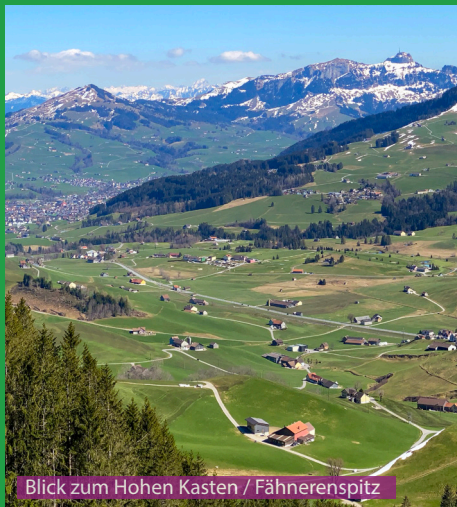
Blick zum Hohen Kasten / Fähnerenspitz