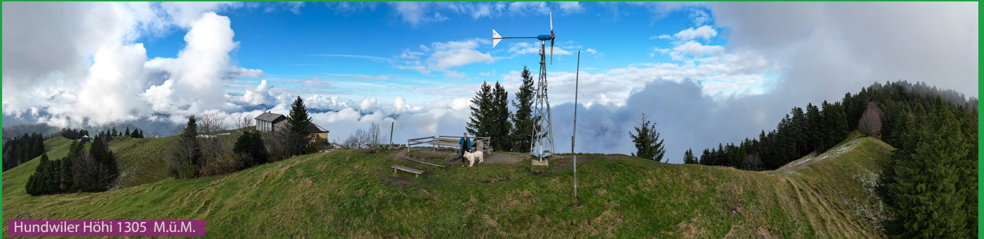
Hundwiler Höhi 1305 M.ü.M.

Die Wanderung ist ab dem Bahnhof resp. bei den Parkplätzen bei Befang gut beschildert. Wir laufen Richtung Hundwiler Höhi und nehmen den Weg links via Bauernhof Egg und Müllershöhi bis zur Hundwiler Höhi. Nach einer Einkehr im sympathischen Bergrestaurant laufen wir via Gigershöhi, Berg, Bühl und Tobel zurück nach Zürchersmühle.