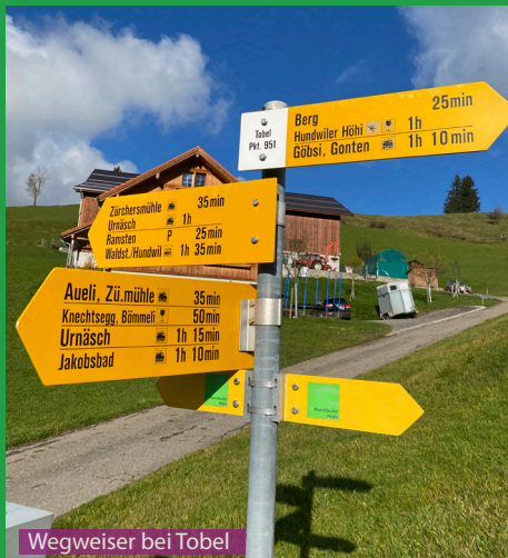
Wegweiser bei Tobel