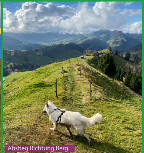
Abstieg Richtung Berg