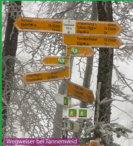
Wegweiser bei Tannenweid