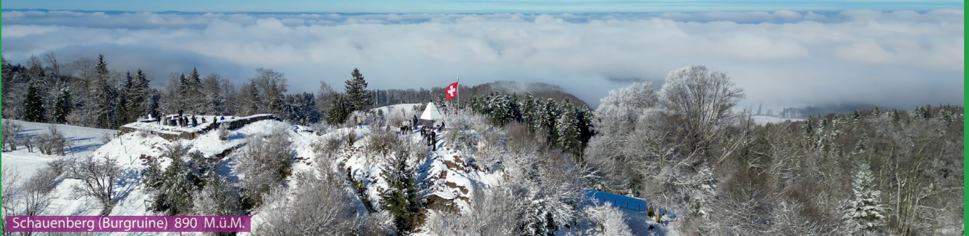
Schauenberg (Burgruine) 890 M.ü.M.

Ab Bahnhof Turbenthal resp. Migros-Parkplatz läuft man rüber zur Schulstrasse und dort links bis zum Wanderwegweiser beim Hutzikerbach. Wir folgen den Wegweisern bis zur Burgruine Schauenberg. Retour laufen wir über Tannenweid zum Hüttstall und folgen dann den Wegweisern Richtung Schnurrberg (GPS beachten) und zurück bis Turbenthal (via Friedhof wieder in die Schulstrasse).