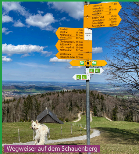
Wegweiser auf dem Schauenberg