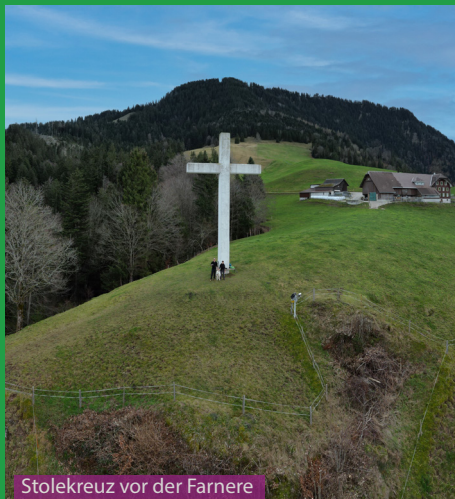
Stolekreuz vor der Farnere