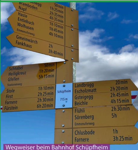
Wegweiser beim Bahnhof Schüpfheim

Vom Bahnhof Schüpfheim bis zur Fruttegg muss man an mehreren Bauernhöfen vorbei oder durchlaufen. Uns ist leider bei jedem Bauernhof ein bellender Hund entgegengesprungen. Lassen sie Ihren Hund in solchen Situationen sofort von der Leine, die Hunde regeln das normalerweise alleine. Ansonsten eine tolle Wanderung für 4-Beiner, bitte Wasser für den Hund nicht vergessen im Rucksack.