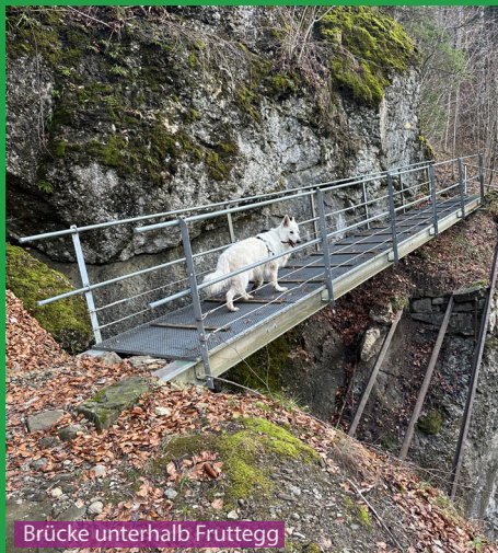
Brücke unterhalb Fruttegg