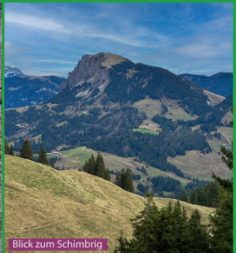
Blick zum Schimbrig