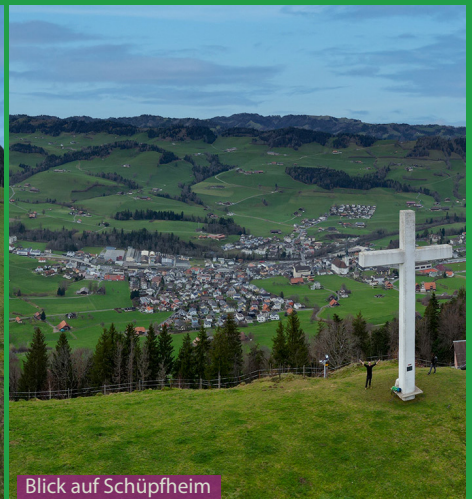
Blick auf Schüpfheim