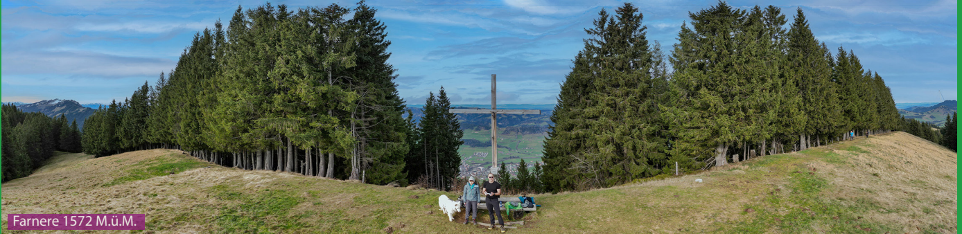
Farnere 1572 M.ü.M.

Dem Wegweiser beim Bahnhof folgen wir Richtung Farnere (3h25). Über den Chlusboden und die Fruttegg laufen wir den 2010 renovierten Frutteggweg hoch bis Unter-/Ober-Farnere und dann zum Gipfel auf 1572 M.ü.M. Der Retourweg zweigt etwas unterhalb dem Gipfel beim Wegweiser Farnere nach links ab. Es geht nun über das Stolehüttli und das imposante Stolekreuz retour nach Schüpfheim.