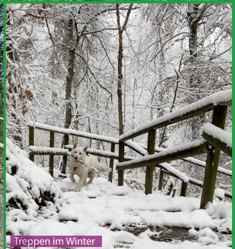
Treppen im Winter