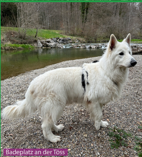
Badeplatz an der Töss