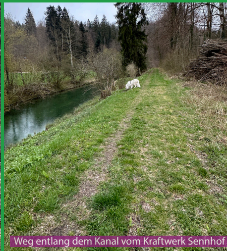
Weg entlang dem Kanal vom Kraftwerk Sennhof