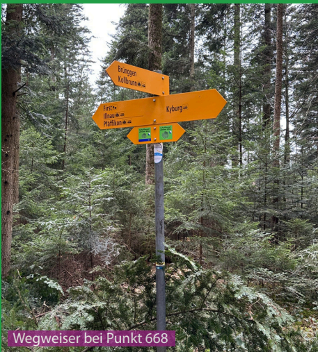
Wegweiser bei Punkt 668

Eine unserer Lieblingsrunden mit Aragon. Es gibt kaum Wanderer unterwegs und der Kanal vom Kraftwerk Sennhof und die Töss laden zum Baden und spielen ein. Auf dem Weg Richtung Sennhof passiert man in der Weidezeit einen Bauernhof mit Schafen (Buechächer), welche von 5 Herdenschutzhunden beschützt werden, hier empfiehlt es sich den Hund kurz an die Leine zu nehmen.