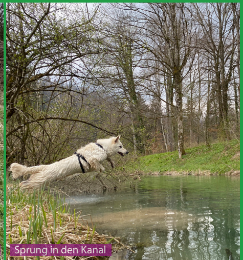
Sprung in den Kanal