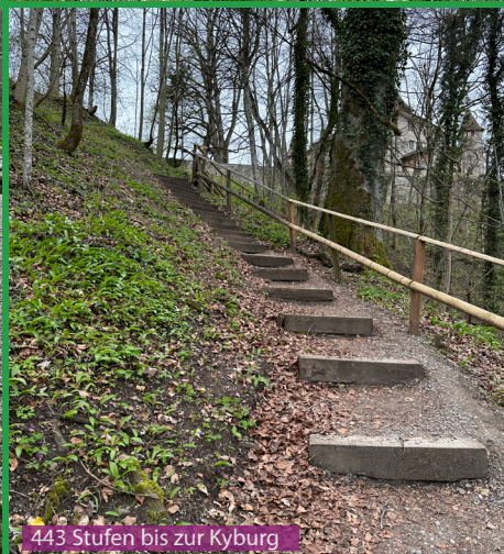
443 Stufen bis zur Kyburg