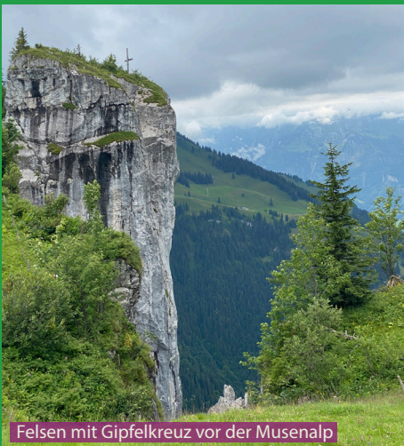
Felsen mit Gipfelkreuz vor der Musenalp