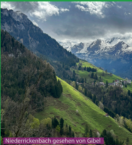
Niederrickenbach gesehen von Gibel

Eine sehr schöne Wanderung für Hunde und auch kleine Kinder ab ca 8 Jahren. Es gibt während der Weidezeit genügend Kuhtränken zum Wassertrinken, ansonsten gehören aber mindestens 0.5 Liter Wasser für den Hund mit ins Gepäck. Der Bleikigrat (blau eingezeichnet auf unserer Karte) ist nicht machbar für Hunde und wir empfehlen diesen auch nicht mit kleinen Kindern zu durchklettern.