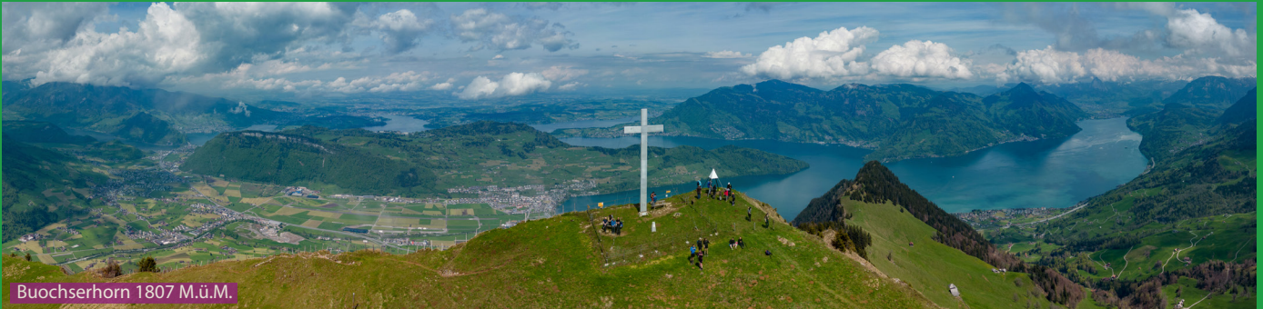
Buochserhorn 1807 M.ü.M.

In Niederrickenbach laufen wir links über Gibel und Arhölzli hoch zum Buochserhorn. Der Abstieg verläuft Richtung Bleikigrat. Wer gerne klettert nimmt hier den Blau-Weissen Wanderweg, Normalwanderer laufen weiter runter und steigen auf dem ebenso spannenden Wanderweg zwischen den steilen Felsen hoch zur Musenalp. Danach via Ahorn und Steinrütli zurück zur Bergstation.