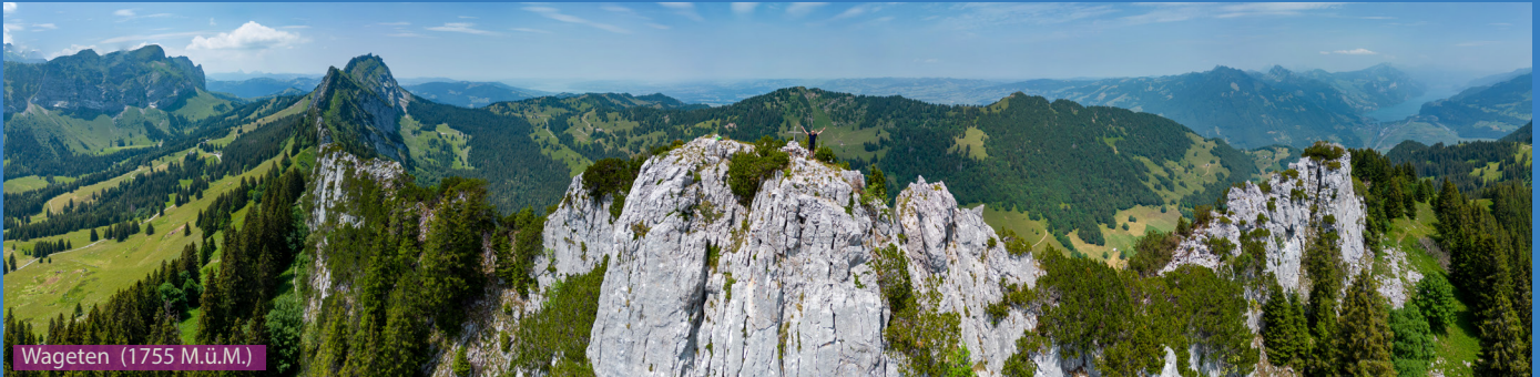
Wageten (1755 M.ü.M.)

Ab Matt folgen wir den Wegweisern Richtung Brüggler und erreichen den ersten Gipfel via Stattboden. Dann retour bis unter die Felswand und der Wand entlang bis Wänifurggel. Auf dem Weg zur Lohegg kann man auf den Wageten klettern, der Weg ist nicht angeschrieben aber man sieht eine Wegspur. Beachten sie GPS File und Karte für den Weg. Retour via Winteregg (Trinkmöglichkeit).