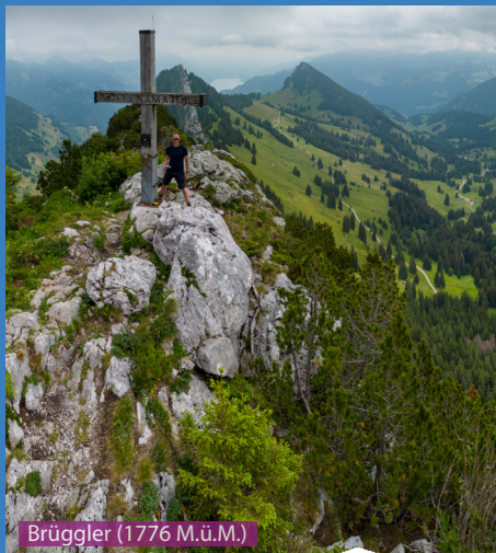
Brüggler (1776 M.ü.M.)