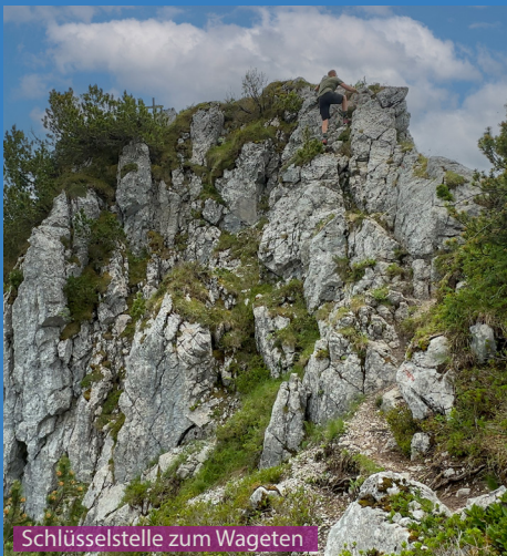
Schlüsselstelle zum Wageten