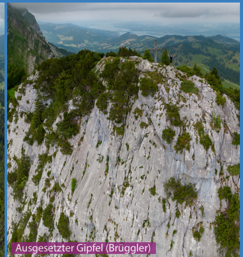
Ausgesetzter Gipfel (Brüggler)