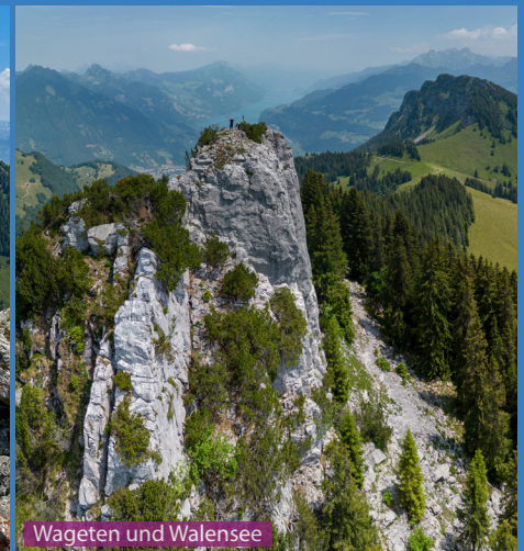
Wageten und Walensee