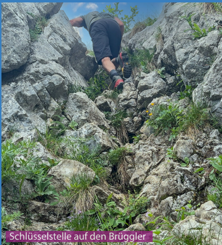
Schlüsselstelle auf den Brüggler

Den Brüggler kann man mit einem Hund machen, wenn man ihn durch ungesicherte Schlüsselstelle schiebt, zieht oder trägt. Auf dem Brügglergrat ist entsprechende Vorsicht geboten (Leine). Der Wageten ist unmöglich mit einem Hund, die Kletterstellen sind zu hoch. Der Rest der Wanderung ist problemlos und es gibt auch keine Schafherden-Schutzhunde auf diesem Weg.