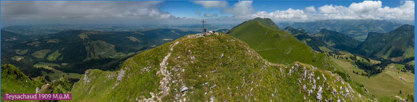
Teysachaud 1909 M.ü.M.

Bei der Bergstation der Standseilbahn (Plan-Francey) steigen wir aus und laufen über Gros-Plané, Le Villard-Dessus und Tremetta hoch auf den steilen Gipfel des Teysachaux. Dann kurz retour und über den wunderschönen Grat (Crête du Moléson) hoch zum Gipfel des Moléson und dann zur Bergstation der Luftseilbahn welche uns zurück nach Plan-Francey bringt.