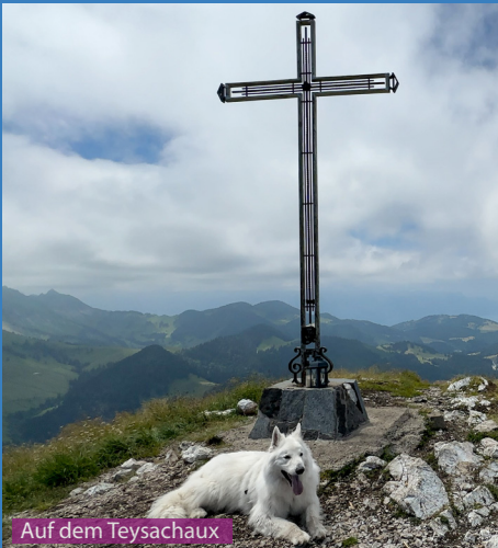
Auf dem Teysachaux