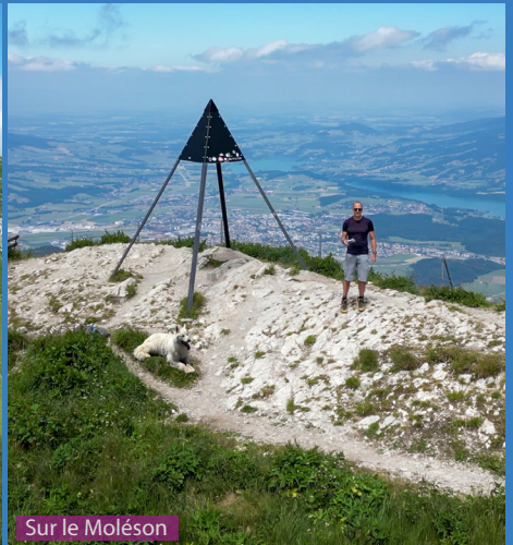
Sur le Moléson