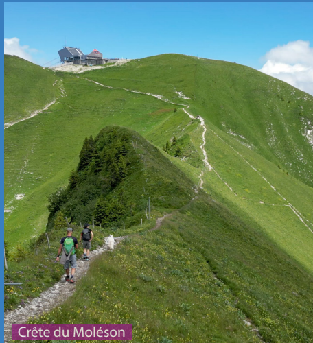
Crête du Moléson