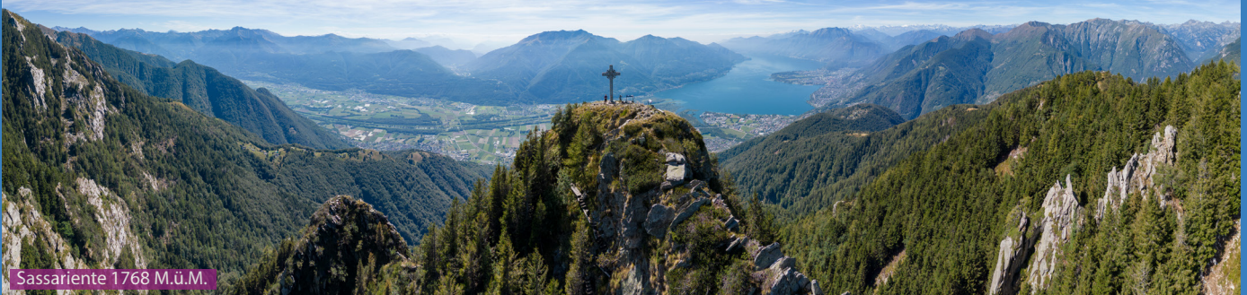
Sassariente 1768 M.ü.M.

Wir folgen dem Wegweiser Richtung Sassariente und verlassen die Teerstrasse nach wenigen Minuten Richtung Rustico Dorf Gana (nicht angeschrieben, Wegspur, GPS beachten). Durch das Dorf laufen wir via Alpe die Foppiana hoch zum Wegweiser Sassariente auf 1756m und weiter zum Gipfel (Cima) auf 1768m. Retourweg gleich bis Alpe di Foppiana aber dann via Scesa zurück zum Parkplatz.