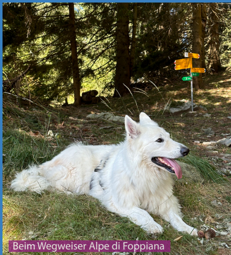
Beim Wegweiser Alpe di Foppiana