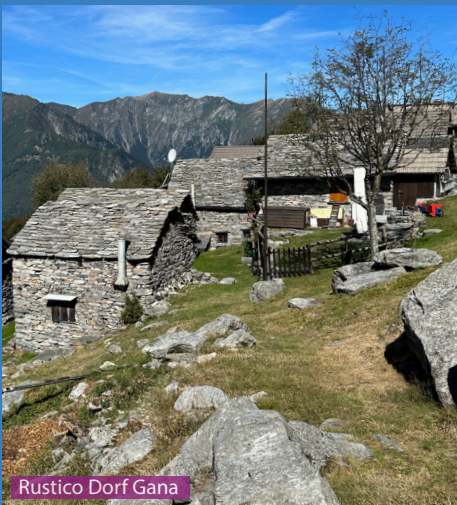
Rustico Dorf Gana

Die Wanderung ist bis zum Wegweiser Sassariente auf 1756m nicht schwierig für Hunde. Ab hier muss man gut auf den Hund aufpassen. Mit etwas Führung schafft ein Hund den Holzsteg und die Holztreppen ohne Hilfe (keine Leine benutzen wegen Absturzgefahr !) Die letzten Meter vor dem Gipfelkreuz braucht der Hund etwas Hilfe, die Felsstufen sind einfach zu steil. Kinder schaffen den Weg ab 12J.