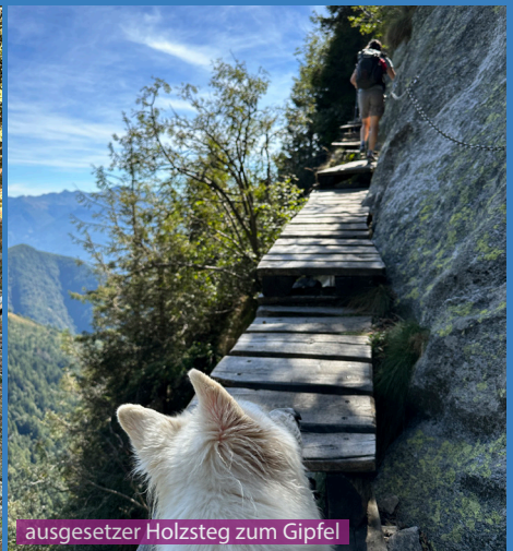
ausgesetzter Holzsteg zum Gipfel