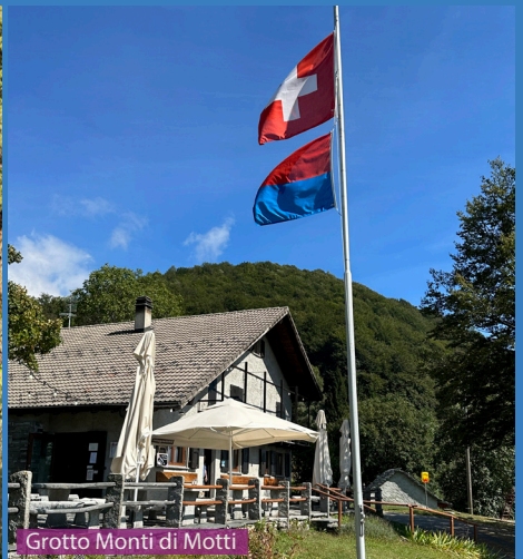
Grotto Monti di Motti