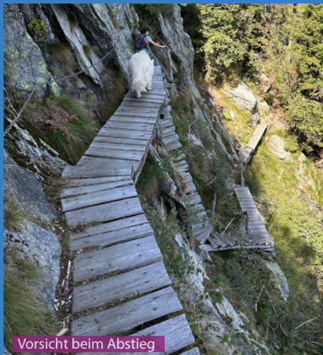
Vorsicht beim Abstieg