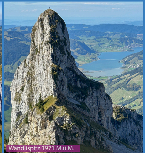
Wändlispitz 1971 M.ü.M.