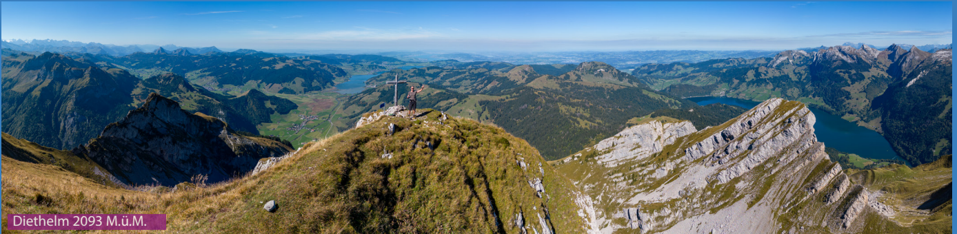
Diethelm 2093 M.ü.M.

Beim Golfplatz-Parkplatz folgen wir dem Wegweiser Richtung Diethelm. Zuerst auf einer breiten Naturstrasse und dann auf Wanderwegen passieren wir Schärm und die Alp Obergross. Weiter steil bis zur Leiter und sehr steil hoch bis zum Gipfel. Abstieg via Fluebrig und dann runter Richtung Wäggitalersee, vorbei an der Alp Fluebrig (Getränke Sa/So) und via Fläschlipass zurück zum Ochsenboden.