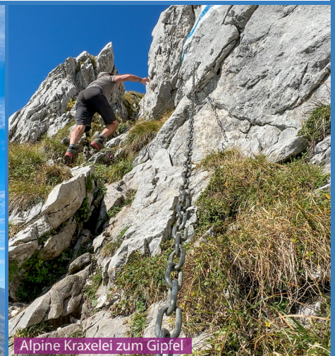
Alpine Kraxelei zum Gipfel