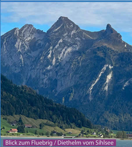
Blick zum Fluebrig / Diethelm vom Sihlsee

Man kann diese Wanderung ohne den letzten blau-weißen Weg zum Diethelm Gipfel gut mit einem Hund machen. Der Aufstieg zum Gipfel ist aber nicht möglich für einen Hund. Wer also einen Hund mitführt sollte mindestens eine weitere Person mit auf die Wanderung nehmen, dann kann man abwechslungsweise auf den Gipfel und der Hund wartet unten. Kinder würde ich erst ab 16 mitnehmen.