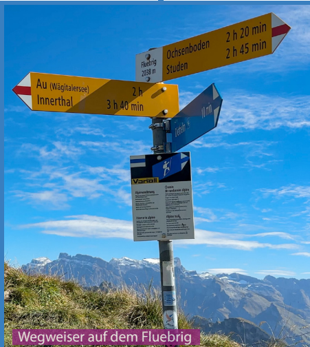
Wegweiser auf dem Fluebrig