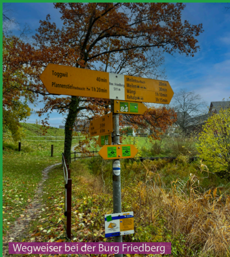
Wegweiser bei der Burg Friedberg