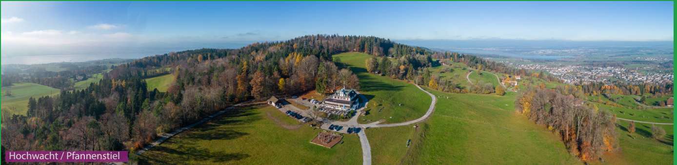
Hochwacht / Pfannenstiel

Direkt hinter der Wirtschaft zur Burg sind die Burgruine und die ersten Wanderwegweiser. Wir folgen ihnen Richtung Toggwil immer dem wunderschönen Dorfbachtobel entlang. In Toggwil überqueren wir die Strasse und laufen auf schönen Waldwegen zur Hochwacht und zum Pfannenstiel Aussichtsturm. Retour laufen wir via Pfannenstiel Waldhütte nach Toggwil und Retour zur Burg.