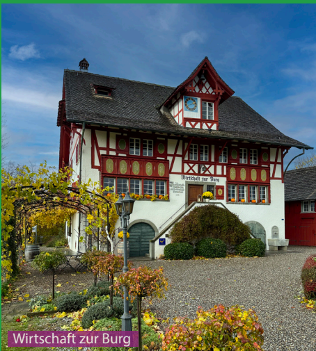
Wirtschaft zur Burg

Tobelwanderung sind das schönste für Hunde die gerne im Wasser spielen. Der Weg bis Toggwil bietet unzählige, ungefährliche Plätze zum spielen und trinken. An schönen Wochenenden muss aber man mit vielen Personen und auch vielen anderen Hunden rechnen. Ab Toggwil bis zum Pfannenstiel wird man sicherlich auch vielen Mountainbikern begegnen (vorausschauend laufen !).