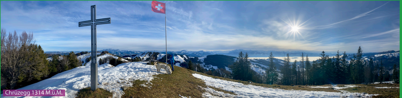
Chrüzegg 1314 M.ü.M.

Wir laufen auf der rechten Seite des Parkplatzes in den Wald und folgen den Wegweisern Richtung Atzmännig Bergstation. Vorbei am Skilift und am Bergrestaurant Harz gelangen wir dann via Rotstein und Tweralpispitz zum Berggasthaus Chrüzegg. Ab hier geht es nochmals hoch zum Gipfelkreuz auf der Chrüzegg und danach konstant abwärts via Oberchamm zurück zum Atzmännig Parkplatz.