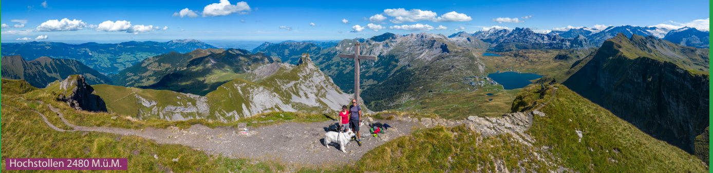
Hochstollen 2480 M.ü.M.

Von der Bergstation läuft man zuerst Richtung Melchsee-Frutt See und dann immer den Wanderwegseisern entlang Richtung Hochstollen. Man läuft am kleinen, schönen Blausee entlang und gelangt dann über Abgschütz auf den Gipfel des Hochstollen auf 2480m. Der Rückweg ist gleich wie der Aufstieg. Wer noch fit genug ist läuft von Abgschütz zum Mittelpunkt der Schweiz und zurück (+2 h).