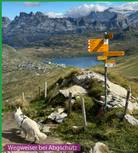
Wegweiser bei Abgschütz