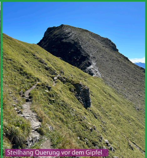
Steilhang Querung vor dem Gipfel