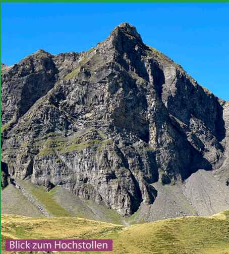
Blick zum Hochstollen

Eine sehr schöne Wanderung mit einem Hund. Im Melchsee-Frutt See und im Blausee kann der Hund spielen, schwimmen und Wasser trinken (Achtung Fischer). Der Auf und Abstieg ist keine Herausforderung für einen berggängigen Hund. Auf dem Gipfel gehört der Hund aus Sicherheitsgründen an die Leine. Es sieht auf dem Gipfel nicht so aus, aber es ist extrem ausgesetzt, siehe Bild Mitte links.