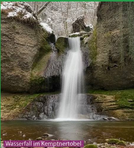
Wasserfall im Kemptnertobel

Tobelwanderung sind das schönste für Hunde die gerne im Wasser spielen. Auf dieser Wanderung läuft man durch 2 Tobel, das Kemptnertobel beim Aufstieg und das Weidtabel beim Abstieg. Hier bieten sich unzählige Plätze zum spielen und trinken an. Das Kemptnertobel ist ein Naturschutzgebiet und Hunde müssen im Tobel an der Leine geführt werden.