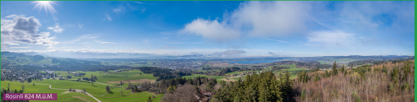
Rosinli 824 M.ü.M.

Wir laufen auf dem Tobelweg durch das schöne Kemptnertobel immer den Wegweisern folgend Richtung Adetswil / Rosinli. Man läuft am grossen Wasserfall, einem kleinen Stausee und 2 Türmen vorbei, die ca 1880 erbaut worden sind um die Wasserkraft zu nutzen. Durch das Dörfchen Adetswil gelangt man zum Restaurant Rosinli. Danach geht es via Waberg / Eggen via Weidtabel zurück nach Kempten.