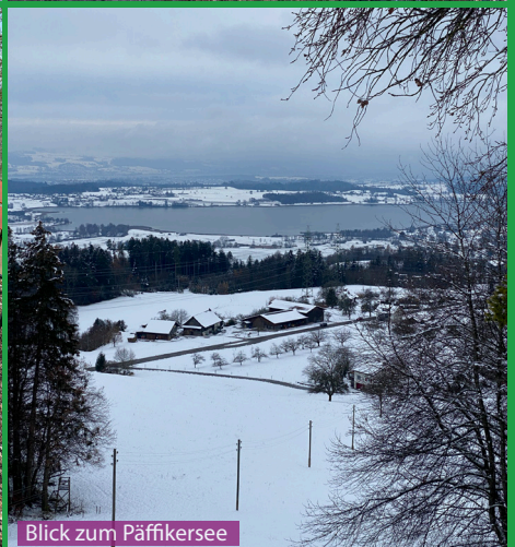
Blick zum Päfikersee