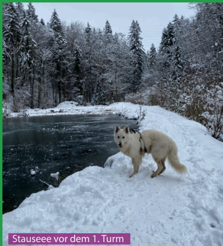
Stausee vor dem 1. Turm