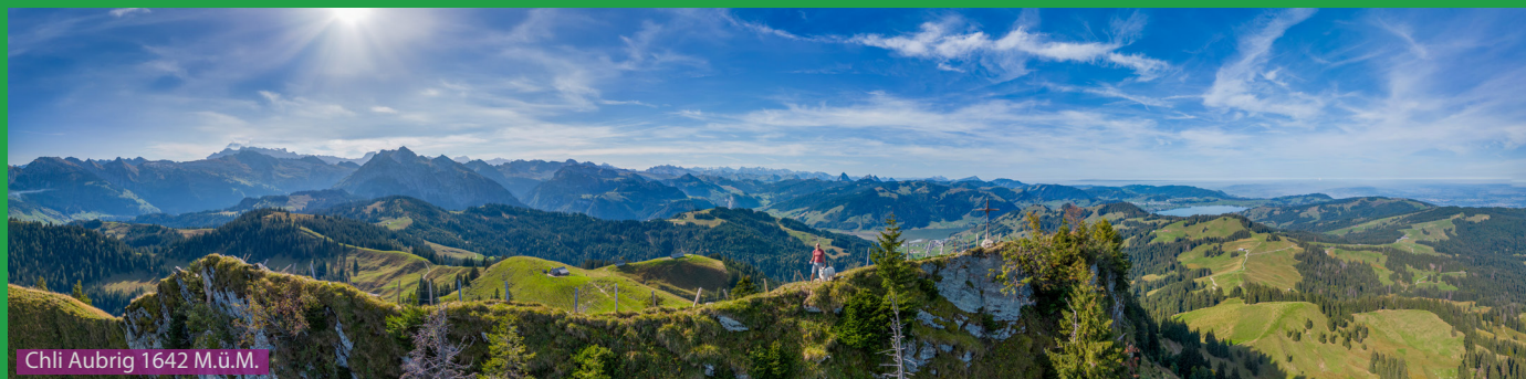
Chli Aubrig 1642 M.ü.M.

Eine wunderschöne 2 Gipfel Tour, welche aufgrund der geringen Höhe der Berge bereits ab April gemacht werden kann. Wir laufen zuerst durch das Sumpfgebiet auf den Gross Aubrig. Der Abstieg vom Gipfel ist nicht so steil und bringt uns nach Nüssen und weiter auf den Chli Aubrig. Hier geht es sehr steil über die Abkürzung oder denselben Weg wie hoch runter und zurück zur Sattellegg.