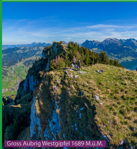
Gross Aubrig Westgipfel 1689 M.ü.M.

Eine problemlose Wanderung für berggängige Hunde. Man durchläuft aber während der Weidezeit einige Kuhherden. Auf den Gipfeln sollte man auf den Hund achten. Jagende Hunde gehören wegen Absturzgefahr an die Leine. Wasser hat es immer wieder auf dem Weg in Kuhtränken oder Bächen. Wir nehmen auf diese Tour immer 0.5 Liter Wasser zusätzlich für den Hund mit.