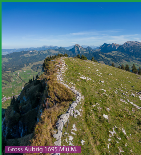
Gross Aubrig 1695 M.ü.M.