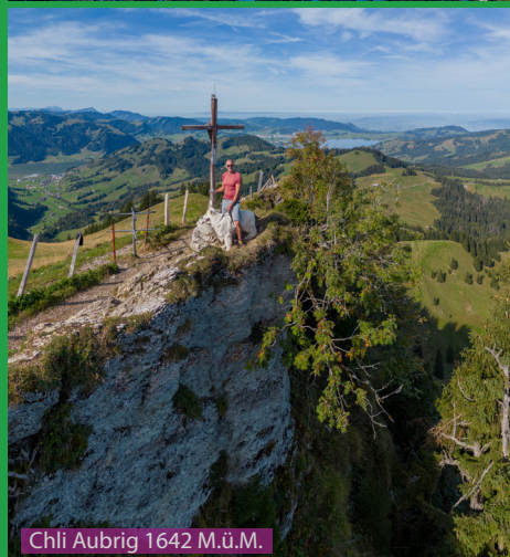
Chli Aubrig 1642 M.ü.M.