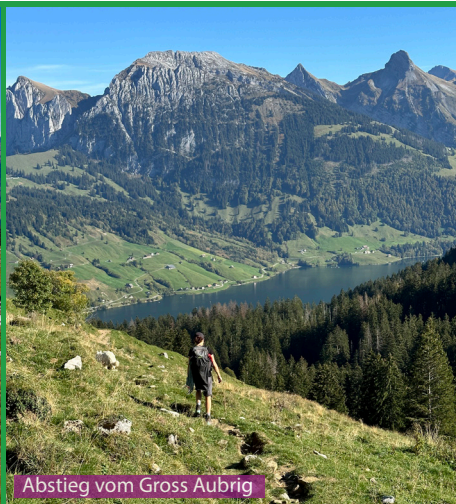
Abstieg vom Gross Aubrig