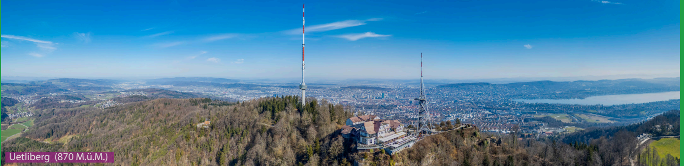
Uetliberg (870 M.ü.M.)

Wir folgen der Uetlibergstrasse bis zum Wald und laufen dann dem Vitaparcours entlang beim Kolbenhof vorbei und steigen via Rossweidliegg hoch zur Claridahütte. Der Gratweg führt uns direkt zum Fernsehturm und weiter auf den Uetliberg (Hotel Uto Kulm). Retour laufen wir via Uto Staffel und folgen dem Weg Richtung Albisgüetli der mit „attraktiv, aber exponiert“ angeschrieben ist.