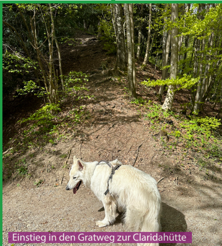
Einstieg in den Gratweg zur Claridahütte