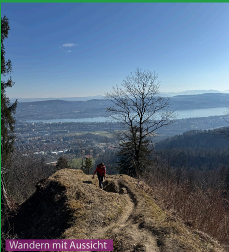
Wandern mit Aussicht