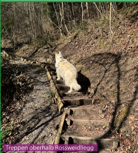
Treppen oberhalb Rossweidliegg

Eine tolle Wanderung für einen berggängigen Hund. Auf dem steilen Stück bei der Claridahütte braucht ein Hund evtl. z.T. etwas Hilfe. Da es leicht ausgesetzt ist, sollten Hunde mit Jagdtrieb hier aus Sicherheitsgründen an die Leine. Wasser gibt es an zwei Brunnen (Beim Fernsehturm und auf dem Planetenweg) und beim Bach im Wald bei der Uetlibergstrasse.