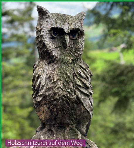
Holzschnitzerei auf dem Weg