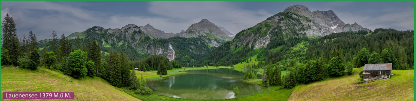
Lauenensee 1379 M.ü.M.

Bei der Rohrbrücke hinter dem Hotel Alpenland sind die Wanderwegweiser. Wir laufen dem Louwibach entlang Richtung Lauenensee via Rohr und halten uns bei der Rossfalleschlucht rechts. Nachdem man rund um den See gelaufen ist läuft man via Legerlibrugg (grosser Parkplatz) zurück runter zur Rossfalleschlucht und dann den gleichen Weg dem Louwibach entlang zurück nach Lauenen.