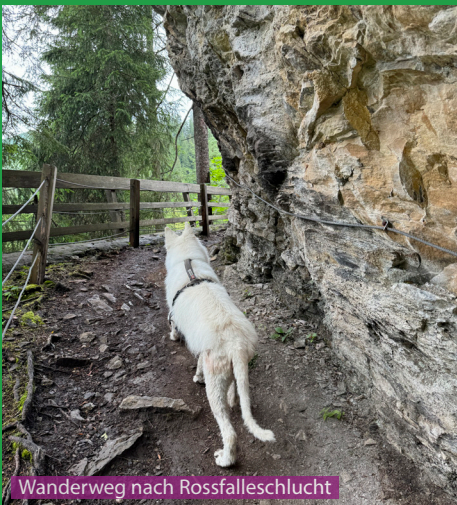
Wanderweg nach Rossfalleschlucht

Eine wunderschöne Wanderung für Hunde. Auf dem Weg dem Louwibach entlang gibt es bereits die ersten Stellen zum Baden und Spielen (auf Strömung achten). Beim Lauenensee folgen weitere schöne Wasserstellen. Die Wanderwege sind für Vierbeiner gut begehbar und es gibt auch keine Kuhherden die man durchqueren muss unterwegs.