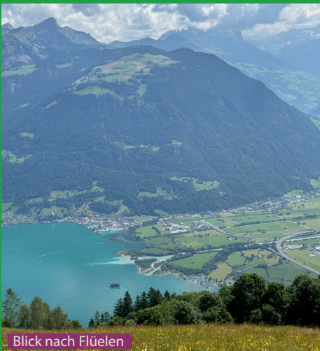
Blick nach Flüelen