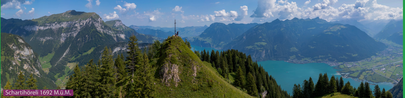
Scharthöhrel 1692 M.ü.M.

Wir folgen zuerst der Strasse bis zum Neihüttli (Nähe Talstation Seilbahn Chlital-Musenalp) und dann beginnt der Aufstieg durch den Wald bis Hinter Wang. Via Vorder Wang gelangen wir aufs Schartihörel und laufen dann via Vorderwang zurück zur Bergstation Gietisflue. Erwachsene zahlen für die Talfahrt 7.-, Kinder und Hunde kosten 3.-.