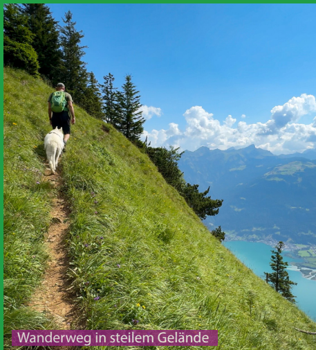
Wanderweg in steilem Gelände