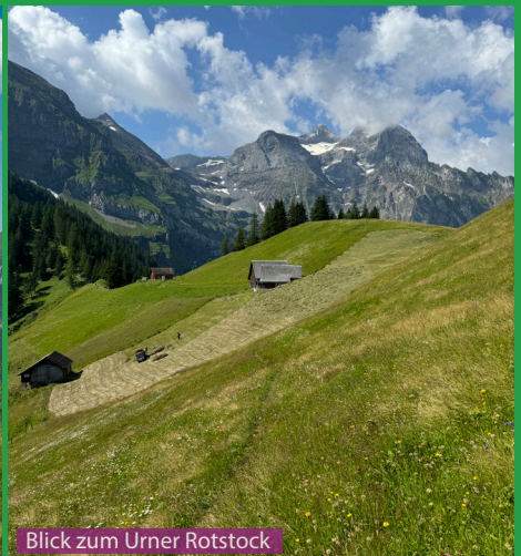
Blick zum Uner Rotstock