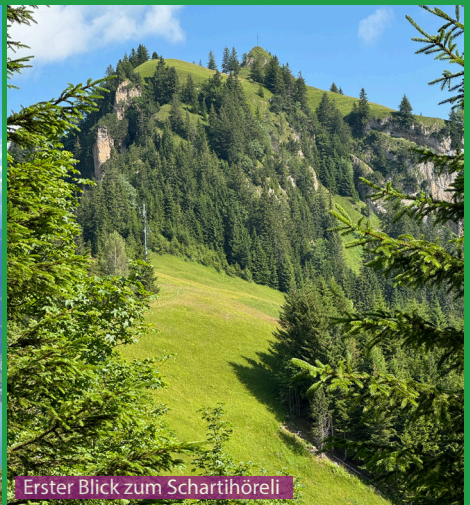
Erster Blick zum Scharthöhrel