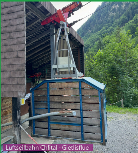
Luftseilbahn Chlital - Gietisflue

Eine absolut tolle Wanderung für Hunde. Im steilen Gelände sollte man auf etwas aufpassen und jagende Hunde gehören hier sicherlich an die Leine. Wasser gibt es kaum unterwegs, so dass mindesten 0.5 Liter Wasser für den Hund in den Rucksack gehören. Wir mussten auf der ganzen Wanderung keine Kuhherden queren, so dass auch dieses Risiko vernachlässigt werden kann.