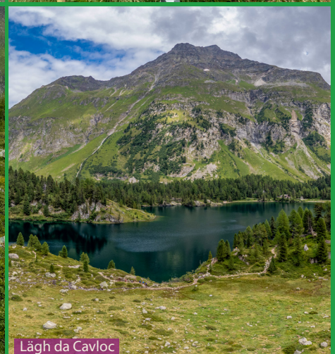
Läggh da Cavloc