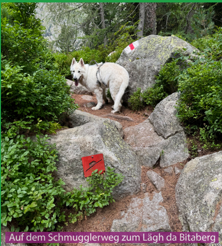
Auf dem Schmugglerweg zum Läggh da Bitabergh

Eine geniale Wanderung für Hunde, insbesondere im Sommer, wenn es im Flachland 30 Grad ist und auf über 2000 Meter Höhe nur rund 20 Grad. Auf dem ganzen Weg gibt es viele Wasserstellen, Seen und Bäche wo der Hund trinken und spielen kann. Man durchquert während der Weidezeit sicherlich am Schluss der Wanderung Kuhherden und muss mit dem Hund entsprechend aufpassen.