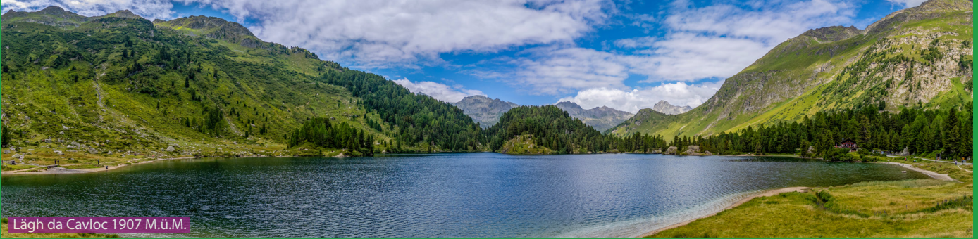
Läggh da Cavloc 1907 M.ü.M.

Wir laufen von der Maloja Passhöhe bis zum Parkplatz Orden und folgen dann dem Schmugglerweg bis zum Läggh da Bitabergh. Jetzt geht es teil hinauf bis nach Motta Salacina und dann via Pass dal Caval runter zum grossen und schönen Läggh da Cavloc. Hier hat es unzählige Buchten die zum Verweilen einladen und auch ein Restaurant. Weiter dann um den See und via Orden zurück zum Auto.