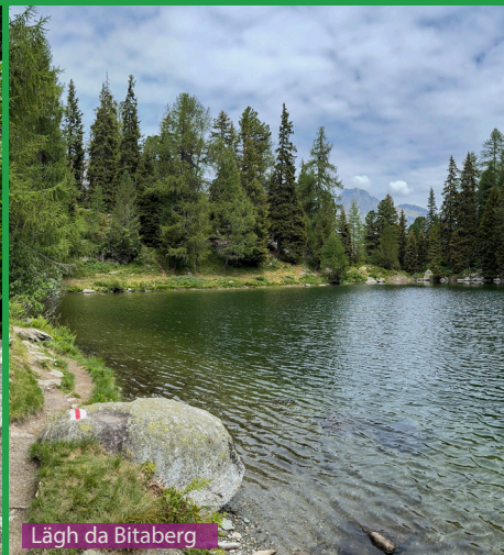
Läggh da Bitabergh