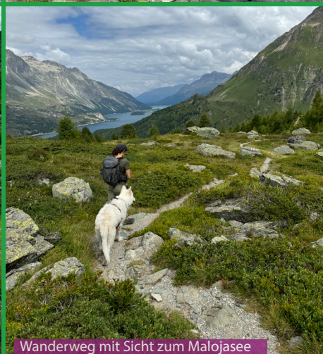
Wanderweg mit Sicht zum Malojasee