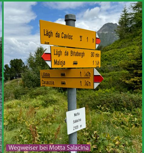
Wegweiser bei Motte Salacina