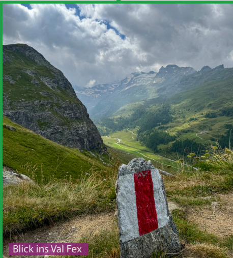
Blick ins Val Fex