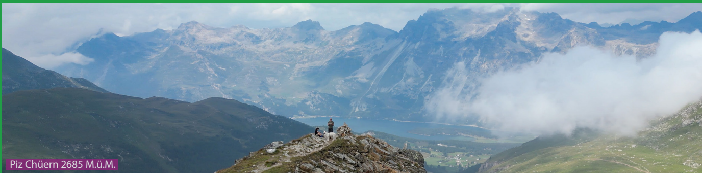
Piz Chüern 2685 M.ü.M.

Wir laufen zum Wanderwegweiser oberhalb der Talstation und folgen dem Weg bis Marmoré (Aussichtspunkt). Hier laufen wir nicht direkt Richtung Piz Chüern, sondern Richtung Val Fex / Fex Curtins. Nach kurzem Abstieg beginnt dann der lange Aufstieg zum Gipfel. Vom Gipfel laufen wir runter zum See (Lej Sgrischus) und dann via Alp Munt zur Mittelstation der Furtschellas Seilbahn.