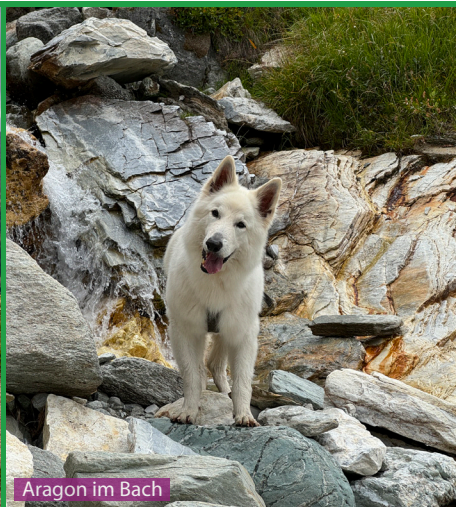
Aragon im Bach