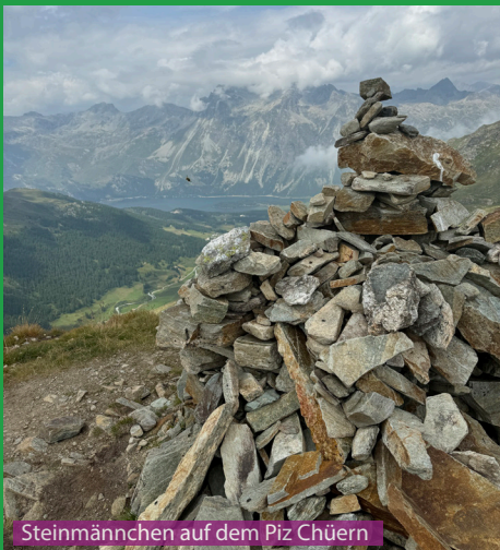
Steinmännchen auf dem Piz Chüern