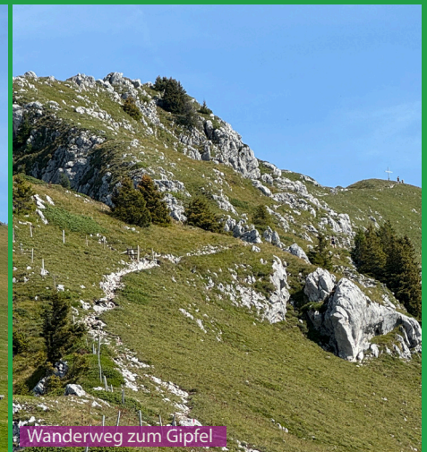
Wanderweg zum Gipfel