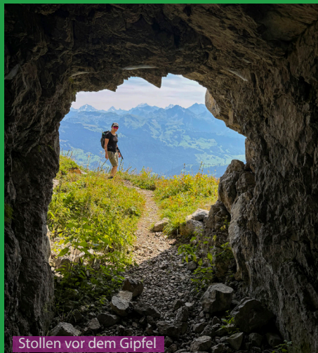
Stollen vor dem Gipfel