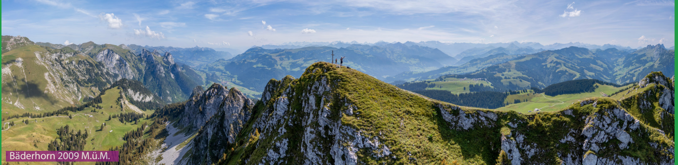
Bäderhorn 2009 M.ü.M.

Die Wegweiser sind zentral bei den Parkplätzen / Busstation platziert. Wir folgen zuerst einer geteerten Strasse bis zum Alpbeizli Grosse Bäder. Ab hier führt ein Bergwanderweg hoch zum Gipfel. Beim Punkt 1746 laufen wir rechts den steilen Hang hoch um auf dem Bergrücken auf einem sehr schönen Wanderweg bis zum Gipfel zu gelangen. Der Retourweg ist der Gleiche wie der Aufstieg.