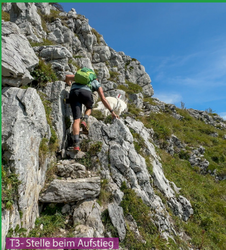
T3- Stelle beim Aufstieg