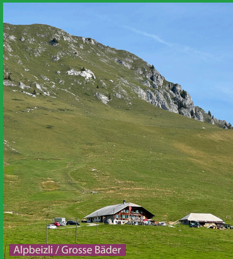
Alpbeizli / Grosse Bäder