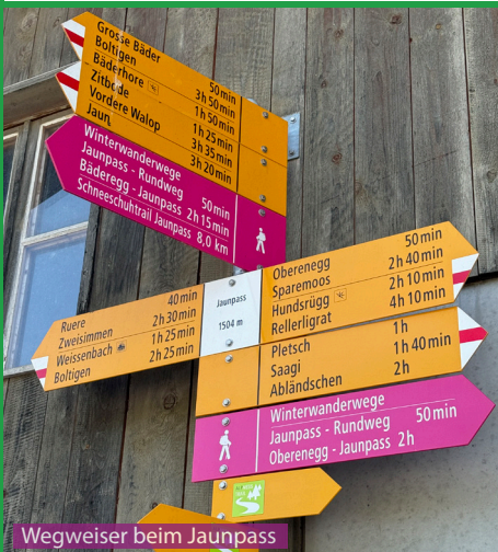
Wegweiser beim Jaunpass

Eine schöne Wanderung für Hunde. Nach der Alpbeiz Grosse Bäder durchquert man Kuhherden während der Weidezeit und muss entsprechend aufpassen. Die gesamte Wanderung kann ein Hund gut ohne Hilfe bewältigen. Auf dem Gipfel ist es sehr ausgesetzt und der Hund gehört aus Sicherheitsgründen an die Leine. Wasser gibt es kaum auf dem Weg, deshalb 0.5 Liter im Rucksack für den Hund.