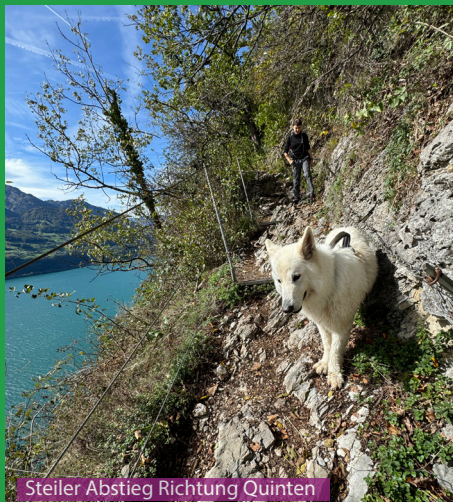
Steiler Abstieg Richtung Quinten