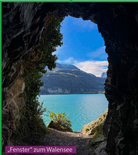
„Fenster“ zum Walensee