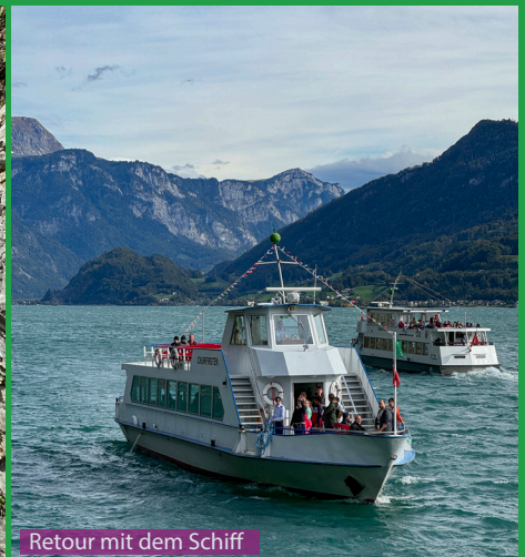
Retour mit dem Schiff