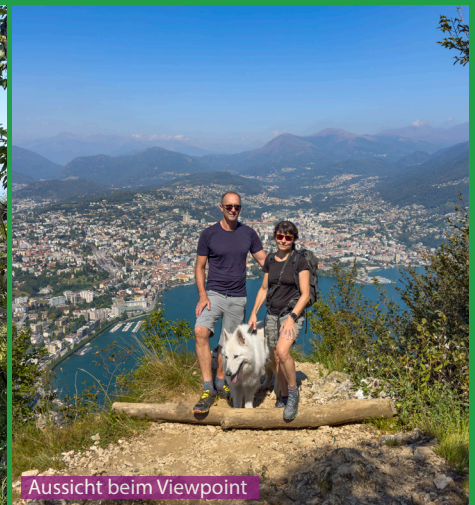
Aussicht beim Viewpoint