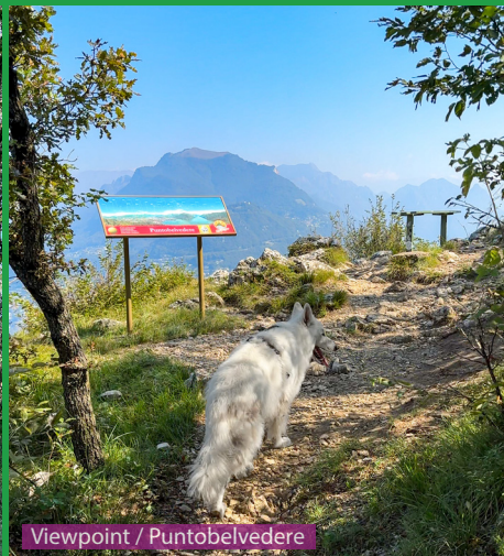
Viewpoint / Puntobelvedere