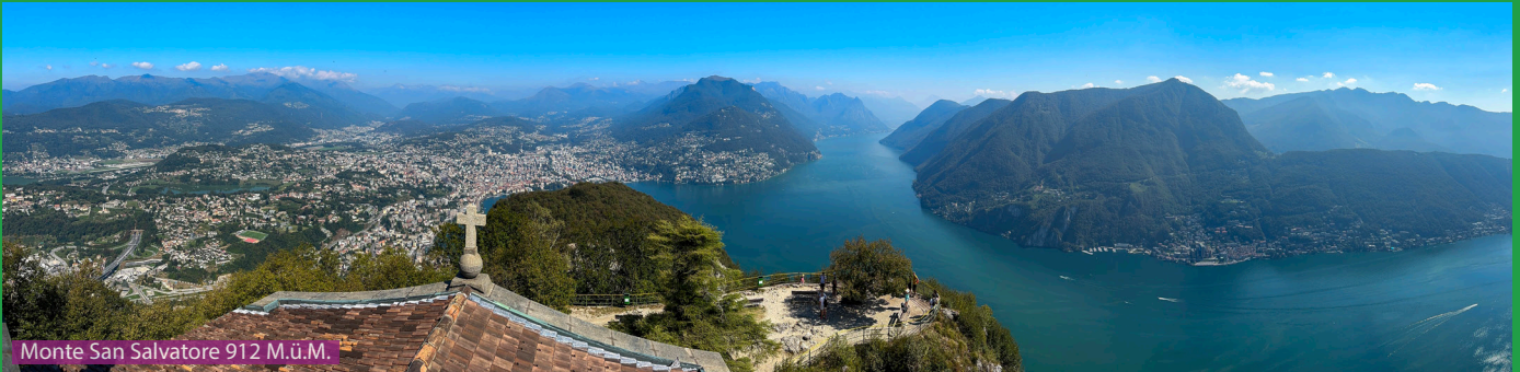
Monte San Salvatore 912 M.ü.M.

Die Wanderwegweiser sind direkt beim Bahnhof Lugano Paradiso. Folgen sie diesen Richtung Monte San Salvatore. Achten sie beim Aufstieg auf den sichtbaren Trampelpfad zum Aussichtspunkt. Auf dem Monte San Salvatore hat man die beste Aussicht auf dem Balkon der Kirche / Capodoro-Terrasse. Etwas unterhalb ist dann das Restaurant / Ristorante Vetta und die Bergstation der Standseilbahn.