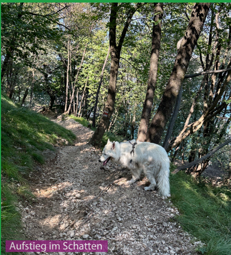
Aufstieg im Schatten

Eine schöne Wanderung auch für Hunde. In den Sommermonaten ist es im Tessin aber sehr heiss und es gibt kein Wasser auf dem Wanderweg, 1 Liter Wasser gehört deshalb für den Hund mit in den Rucksack. An Wochenenden und vor allem auf dem Gipfel hat es wegen der Standseilbahn an Wochenenden sehr viele Leute, daher gehört der Hund auf dem Gipfel und beim Restaurant an die Leine.