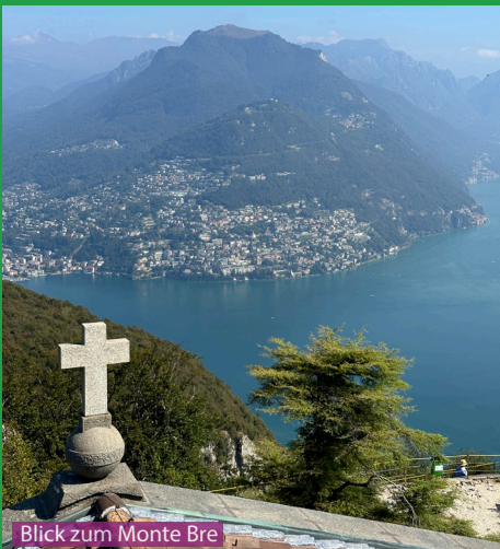
Blick zum Monte Bre