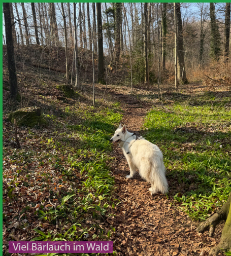
Viel Bärlauch im Wald