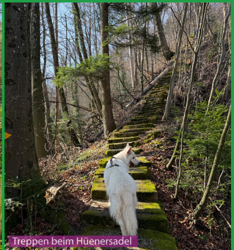
Treppen beim Hüenersadel