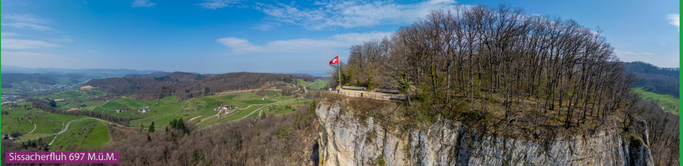
Sissacherfluh 697 M.ü.M.

Wir laufen die Feldstrasse hoch in den Wald und folgen den Wegweisern zuerst Richtung Sissacher Fluh und dann Richtung Burgruine. Der wunderschöne Weg führt uns über den Hüenersadel mit vielen Treppen hoch zur Rickenbacherflue, Böcktenflue und zur Ruine. Danach quert man den Hang zur Sissacherfluh und läuft via Wintersingerhöchi durch den kühlen Wald zurück zum Startpunkt.