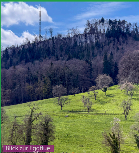
Blick zur Eggflue