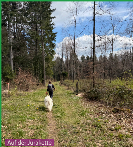
Auf der Jurakette