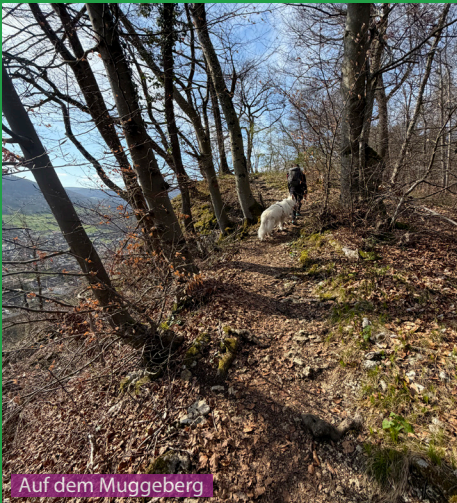
Auf dem Muggeberg

Diese Wanderung kann man mit dem Hund problemlos das ganze Jahr machen. Die Wege sind schön ausgebaut und verlaufen oft schattig im Wald. Es gibt aber erst am Schluss beim Chlusbach Wasser zum trinken, so dass ca 1 Liter Wasser für den Hund mit in den Rucksack gehört. Vom 1. April bis 31. Juli ist in Basel im Wald und an Waldrändern Leinenpflicht.