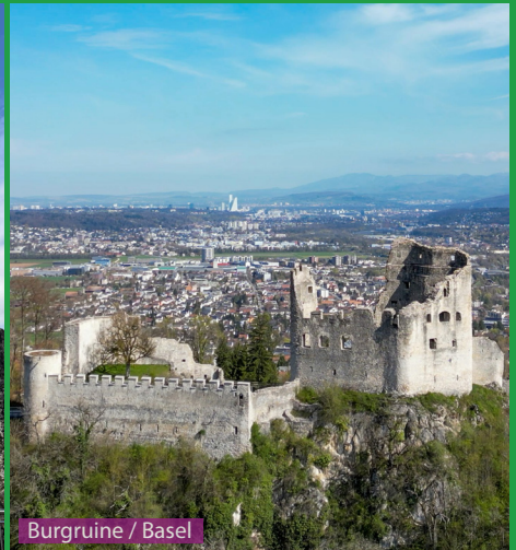
Burgruine / Basel