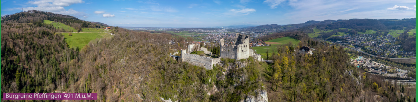
Burgruine Pfeffingen 491 M.ü.M.

Wir wandern über den schönen Muggeberg zur Burgruine Pfeffingen. Via Grossi Weid gelangen wir hoch zur Eggflue und laufen auf der Jurakette entlang bis zum Blattepass. Ab hier startet der Abstieg Richtung Untere Chlus wobei an der Ruine Froberg. Wer will macht noch einen Abstecher zur Burgruine Schalberg. Ansonsten läuft man direkt dem Chlusbach entlang zurück nach Aesch.