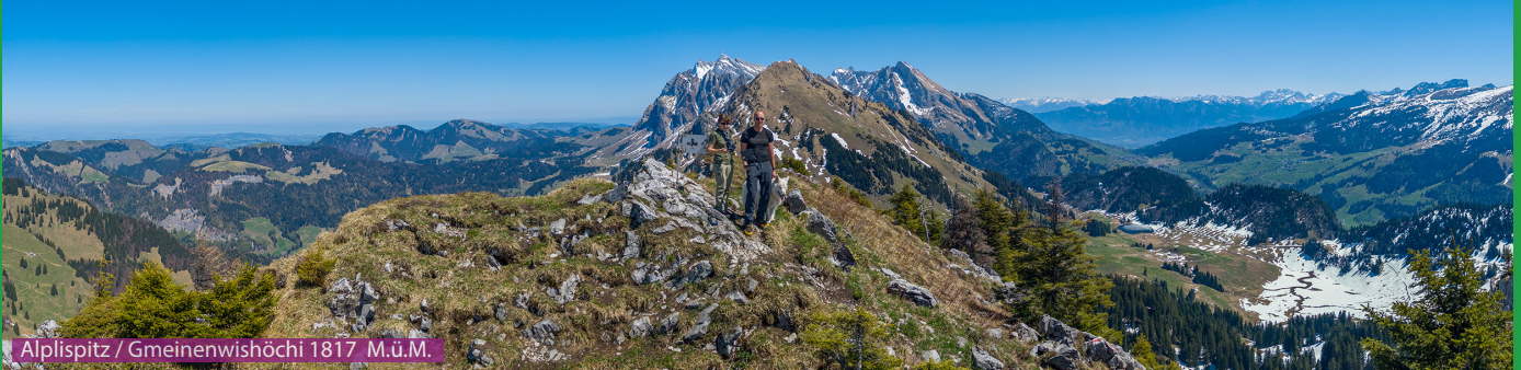
Alplispitz / Gmeinenwishöchi 1817 M.ü.M.

Wir laufen kurz die Strasse hoch und folgen dann dem Wanderwegweiser bei Unterschwendli Richtung Oberstofel. Jetzt geht es steil hoch zur Gmeinenwis und dann rüber zum Alplispitz (Gmeinenwishöchi). Von hier laufen wir kurz retour zur Gmeinenwis und nehmen dann den knackigen Gratweg zum Neuenalpispitz. Der Abstieg erfolgt über Schlafstein und Oberstofel zurück zum Ausgangspunkt.