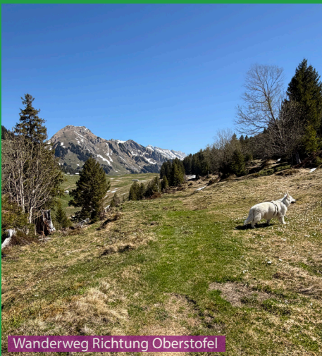
Wanderweg Richtung Oberstofel

Eine schwierige Wanderung für einen Hund. Wir haben sie mit unserem Weissen Schweizer Schäferhund bereits einige Male gemacht. Den Gratweg zwischen Gmeinenwis und Neuenalpispitz schafft ein Hund nicht ohne Hilfe. Es braucht ein gut eingespieltes Mensch-Hund Team um diesen Weg ohne Risiko zu begehen. Auch Kinder würde ich auf diesem Grat zusätzlich vor Absturz absichern.