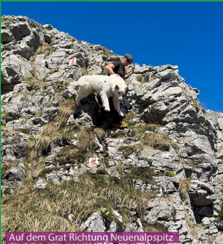
Auf dem Grat Richtung Neuenalpispitz