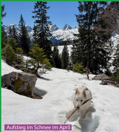
Aufstieg im Schnee im April