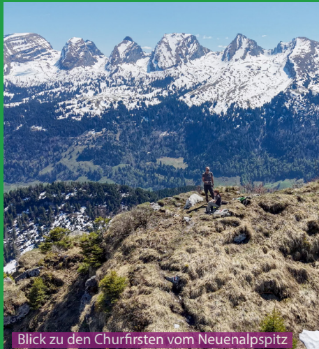
Blick zu den Churfirsten vom Neuenalpispitz