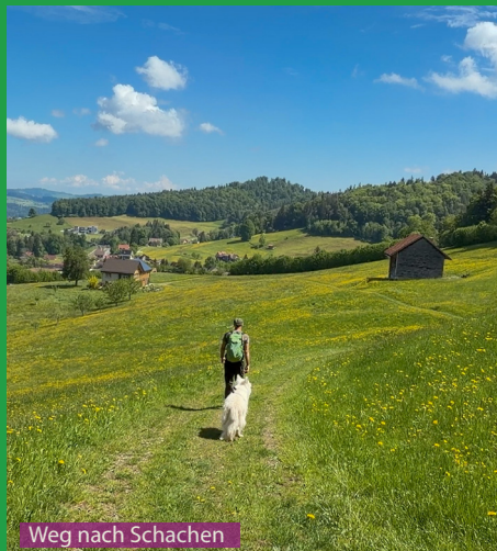
Weg nach Schachen