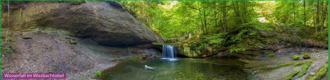
Wasserfall im Wissbachtobel

Die Wanderung führt uns vorbei an der Schwänbergbrücke ins schöne Wissbachtobel mit seinen Stauseen und dem schönen Wasserfall. Nach dem Tobel läuft man via Talmühle und dem Wanderweg hinter dem Restaurant Kantonsgrenze folgend durch schöne Felder und Wiesen nach Schachen bei Herisau und von dort zurück nach Schwänberg.