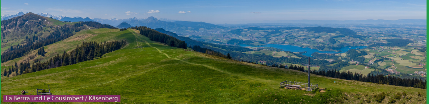
La Berra und Le Cousimbert / Käsenberg

Wir wandern der Gondelbahn entlang bis nach La Tschaka. Ab hier geht es durch einen wunderschönen Wald mit Bächen und Brücken hoch zum ersten Gipfel Le Cousimbert / Käsenberg. Über den flachen Grat laufen wir via Supillette hoch zum nächsten Gipfel La Berra. Wir überqueren den Gipfel und laufen dann via Gîte d'Allières und La Tschaka zurück zum Parkplatz bei Le Brand.