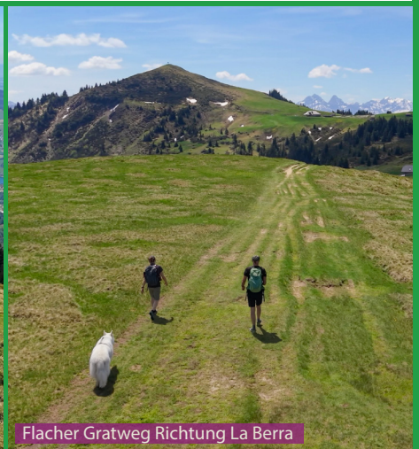
Flacher Gratweg Richtung La Berra