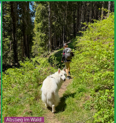
Abstieg im Wald