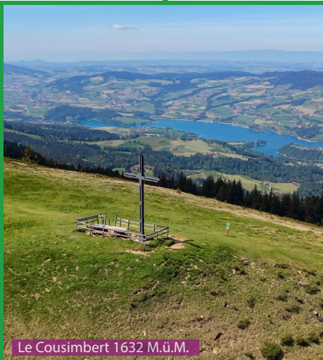
Le Cousimbert 1632 M.ü.M.