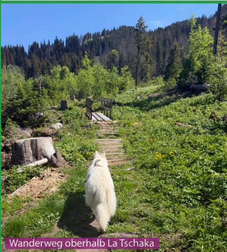
Wanderweg oberhalb La Tschaka

Eine einfach und schöne Wanderung für einen Hund. Es gibt einige Bäche auf dem Weg und auch einige Kuhtränken. Während der Weidezeit läuft man durch die Kuhherden hindurch und muss mit dem Hund entsprechend aufpassen. Wir machen die Wanderung am liebsten wenn die Sesselbahn/Gondelbahn noch nicht fährt und die Kühe noch im Tal sind.