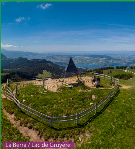
La Berra / Lac de Gruyère