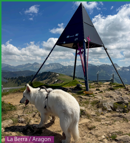
La Berra / Aragon