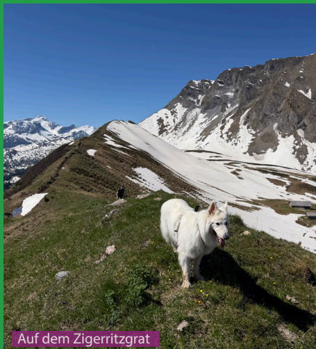
Auf dem Zigerritzgrat