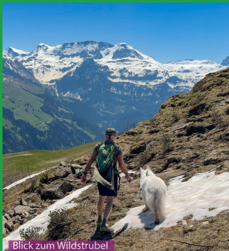
Blick zum Wildstrubel