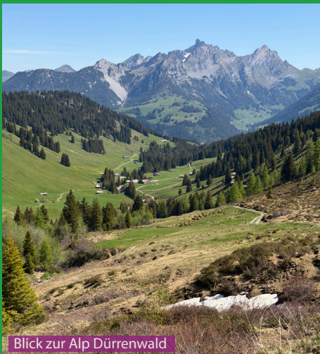
Blick zur Alp Dürrenwald

Eine problemlose Wanderung für Hunde. Es gibt unzählige Bäche mit Trink- und Spielgelegenheiten auf dem Aufstieg. Während der Weidezeit können die Kuhherden bis zum Gipfelkreuz hochlaufen. Wer dann mit dem Hund unterwegs ist, muss entsprechend vorsichtig sein. Für Kinder ist die Wanderung ab 6 Jahren möglich, und dank der acht Jodler-Stationen auch motivierend und abwechslungsreich.