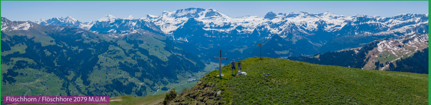
Flöschhorn / Flöschhorn 2079 M.ü.M.

Wir laufen über die Brücke und folgen dann dem Wanderwegweiser bei Dürrenwald Richtung Flöschhorn. Über die Alp Zigerritz gelangen wir auf den flachen Gipfel mit dem schönen Gipfelkreuz. Die Aussicht auf dem Gipfel ist überwältigend. Der Abstieg erfolgt über Flösch nach Eggmatten und dann zurück zum Parkplatz bei der Alp Dürrenwald.