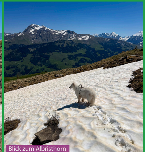
Blick zum Albristhorn