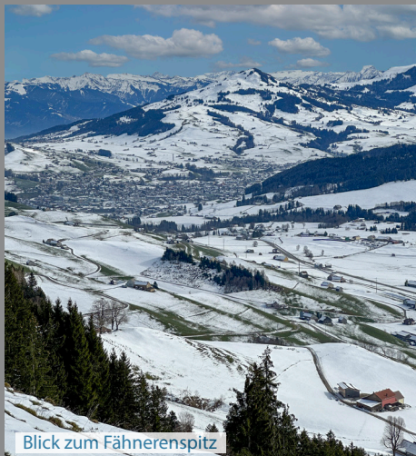
Blick zum Fächerenspitze