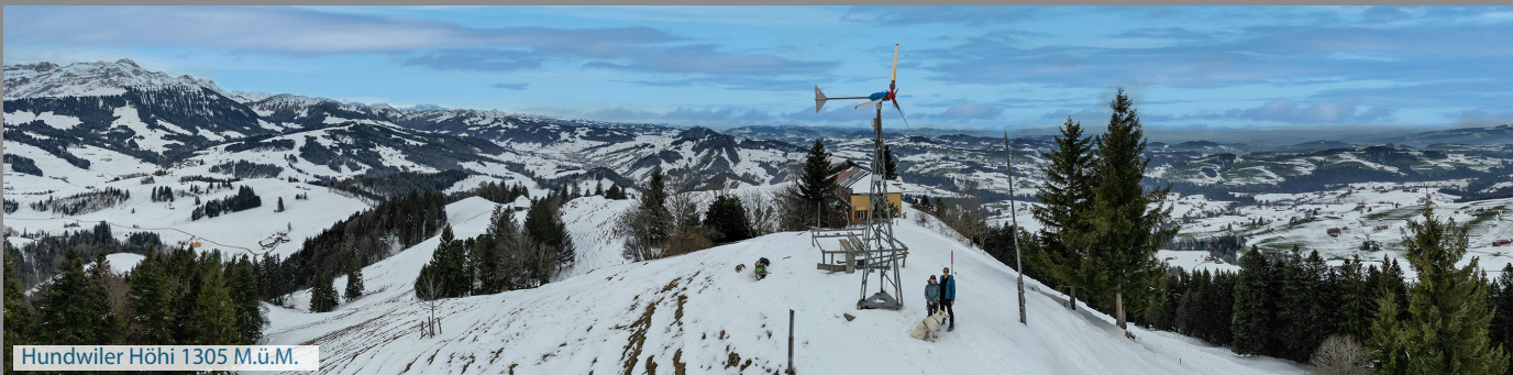
Hundwiler Höhi 1305 M.ü.M.

Die Wegweiser sind direkt beim Bahnhof. Die Schneeschuhroute ist lila angeschrieben und verläuft grösstenteils auf dem normalen Wanderweg. Unsere Karte und das GPS File helfen auf dem richtigen Weg zu bleiben. Auf der Hundwiler Höhi gibt es eine sympatische Bergbeiz mit einem bedienten Restaurant innen und Selbstbedienung draussen.