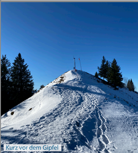
Kurz vor dem Gipfel

Der Name ist Programm, Hunde fühlen sich rund um die Hundwiler Höhi sehr wohl :-). Die Wege sind super zum laufen und wenn genug Schnee liegt hat der Hund auch immer etwas zum trinken auf dem Weg. Im Sommer oder falls wenig Schnee liegt im Winter kann man die Hundwiler Höhi auch ab Zürchersmühle oder Urnäsch erwandern.