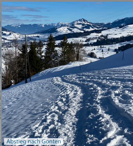
Abstieg nach Gonten