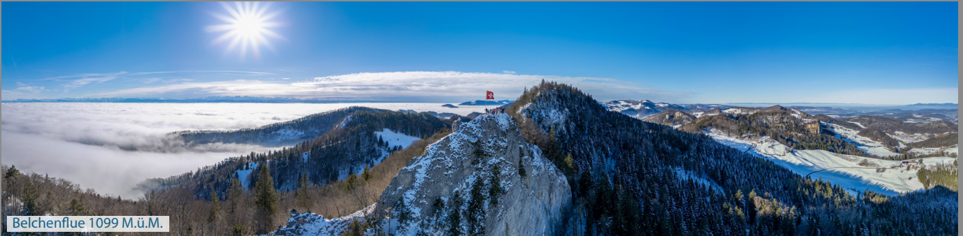
Belchenflue 1099 M.ü.M.

Je nach Schneehöhe macht man diese Tour als Schneeschuhwanderung (bei Neuschnee) oder als Winterwanderung (Spikes unter den Schuhen empfohlen). wir laufen via ehemaligem Sanatorium zur Wuesthöchi, Gwidemhöchi und Belchen-Süd auf die Belchenflue. Auf dem Retourweg biegen wir bei der Wuesthöchi links ab und laufen via Wuestweg zurück zur Bergwirtschaft / Parkplatz.