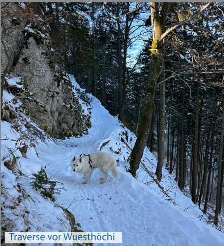
Traverse vor Wuesthöchi

Eine tolle Wanderung mit einem Hund. Bei der Bergwirtschaft Allerheiligenberg läuft der Hund vom Restaurant frei herum, ist aber sehr freundlich. Wir haben jedes Mal unzählige Hunde getroffen auf dem Weg. Die Wege sind wirklich toll zum laufen für Mensch und Tier. Auf dem Weg hoch zur Aussichtsplattform hat es an Wochenenden viele Leute, das kann stressig werden für einen Hund.