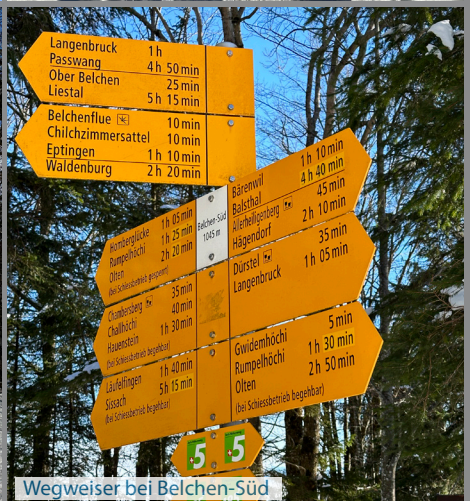
Wegweiser bei Belchen-Süd