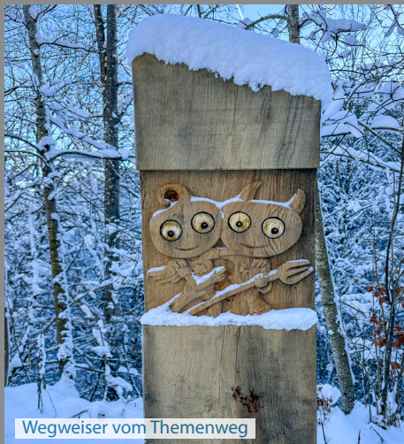
Wegweiser vom Themenweg